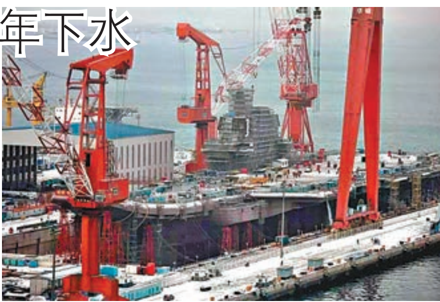
內地媒體發佈的國產航母正在建造的照片。

徐光裕同時強調，中國不會像美國那樣實行全球干預，但航母的實戰能力及全球巡航能力必須具備，比如一旦展開撤僑行動，航母一定要能到達相關海域才行。