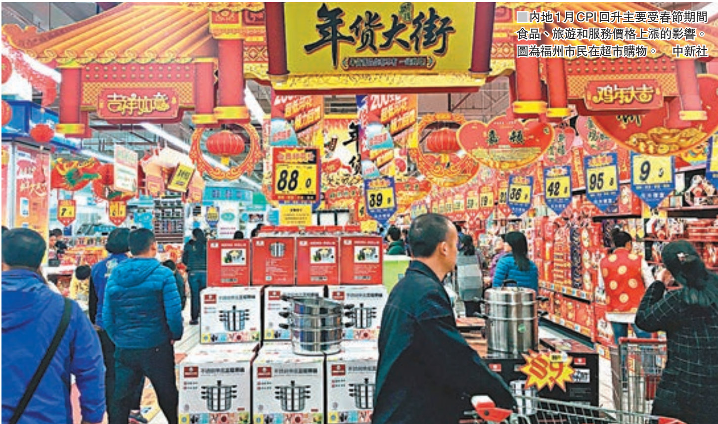
內地1月CPI回升主要受春節期間食品、旅遊和服務價格上漲的影響。圖為福州市民在超市購物。

交通銀行首席經濟學家連平則指出，1月剔除食品和能源的核心CPI同比上漲2.2%，漲幅比上月上升0.3個百分點，是2014年2月以