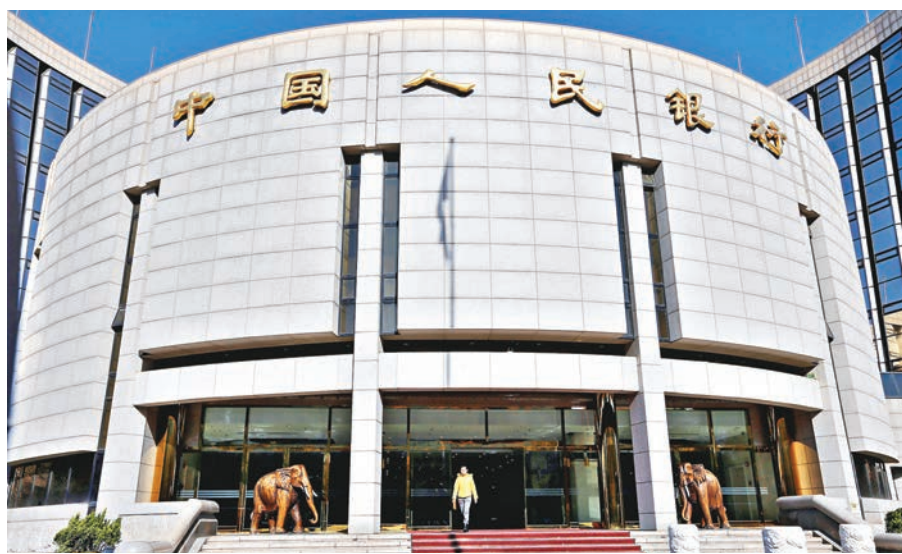
央行昨天在公開市場重啓逆回購,合計共1,000億元人民幣。資料圖片

隨著美國進入加息周期,中國內地已連續釋放貨幣政策收緊的信號。中國央行於1月底上調6個月和1年期MLF利率,於農曆新年假期後開工首日即上調公開市場逆回購操作利率,同時調高了常備借貸便利(SLF)利率。這一系列舉措