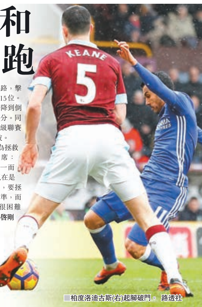
柏度洛迪古斯(右)起腳破門。