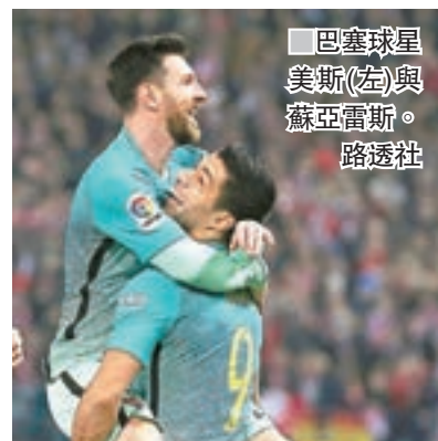
巴塞球星美斯(左)與蘇亞雷斯。

PSG以團隊對付巴塞的「MSN」，但提到PSG就不可不提卡雲尼。今季卡雲尼在法甲聯賽入25球，各項賽事入33球，鋒力十足。不過，卡雲尼是征戰歐洲第五大聯賽——法甲聯賽，其總入球含金量要扣分。正因此，為了證明實力，烏拉圭國腳必然會在今仗中，向全世界展現實力。