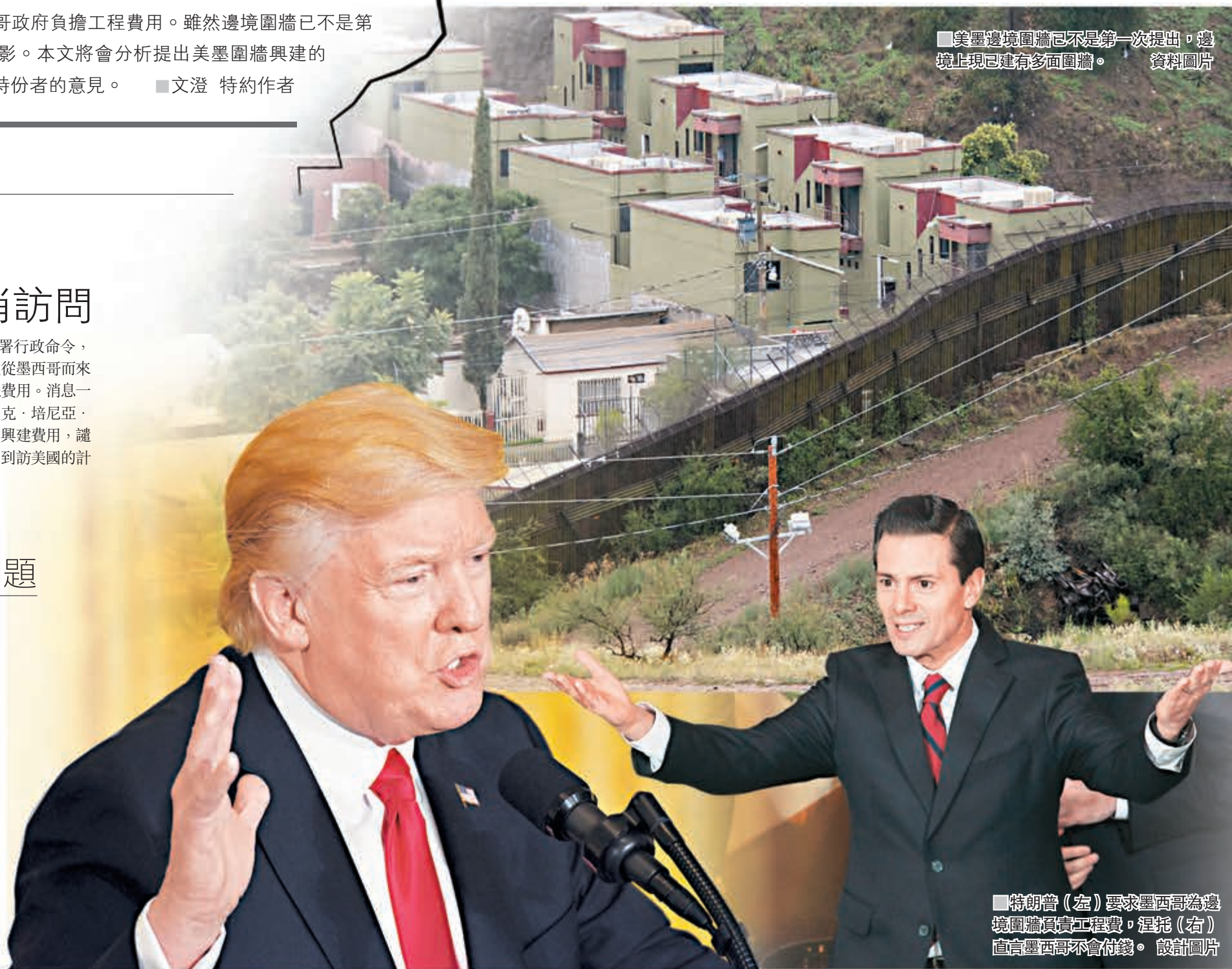
■特朗普(左)要求墨西哥為邊境圍牆填實工程費，涅托(右)直言墨西哥不會付錢。 設計圖片