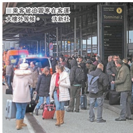
乘客被迫冒寒在客運大樓外等候。