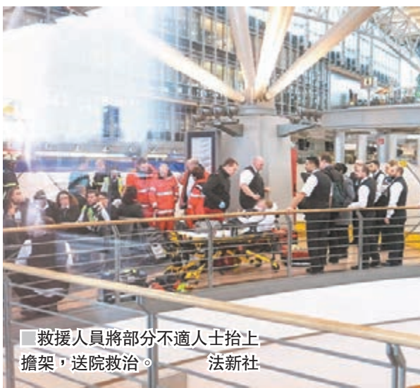
救援人員將部分不適人士抬上擔架，送院救治。