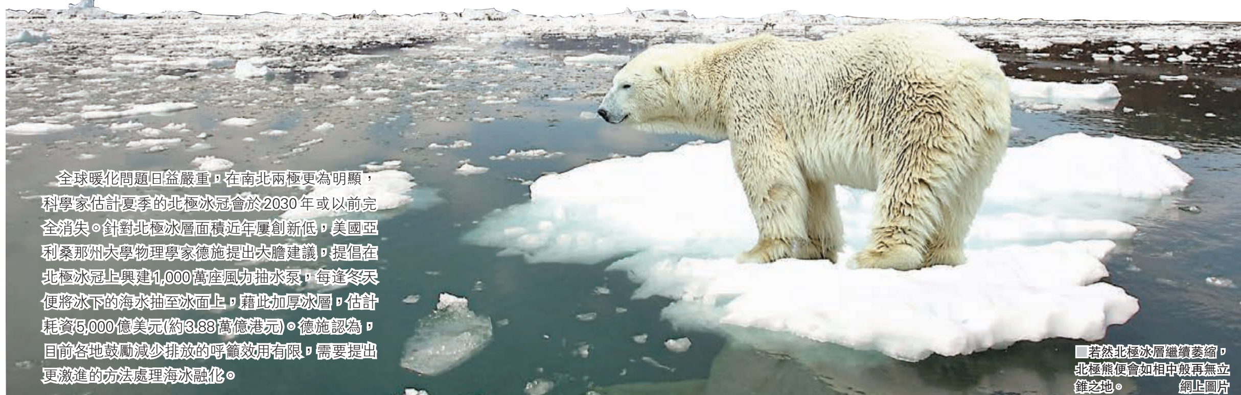
若然北極冰層繼續萎縮，北極熊便會如相中般再無立錫之地。

全球暖化問題日益嚴重，在南北兩極更為明顯，科學家估計夏季的北極冰冠會於2030年或以前完全消失。針對北極冰層面積近年屢創新低，美國亞利桑那州大學物理學家德施提出大膽建議，提倡在北極冰冠上興建1,000萬座風力抽水泵，每逢冬天便將冰下的海水抽至冰面上，藉此加厚冰層，估計耗資5,000億美元(約3.88萬億港元)。德施認為，目前各地鼓勵減少排放的呼籲效用有限，需要提出更激進的方法處理海冰融化。