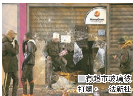
有超市玻璃被打爛。

16歲示威者從一架起火汽車中救出一名被困女童，其英雄行為及後在社交網站獲大肆讚揚。法國其他多個城市包括魯昂、圖盧茲和南特，也有民眾集會聲援泰奧。