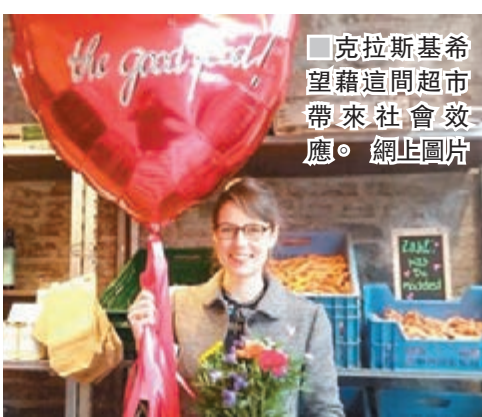
克拉斯基希望這間超市帶來社會效應。

及思考如何消費，「好食物」是這趨勢的一部分，內裡的家具及設施均是二手貨及以回收材料製造。