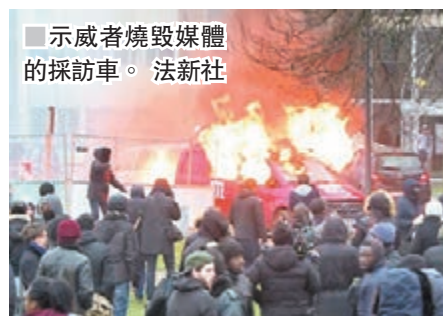
示威者燒毀媒體的採訪車。

警方表示，數百名滋事者到處破壞，他們搗毀兩間商店和一個巴士站，又燒毀4輛汽車，包括兩架傳媒採訪車，一名