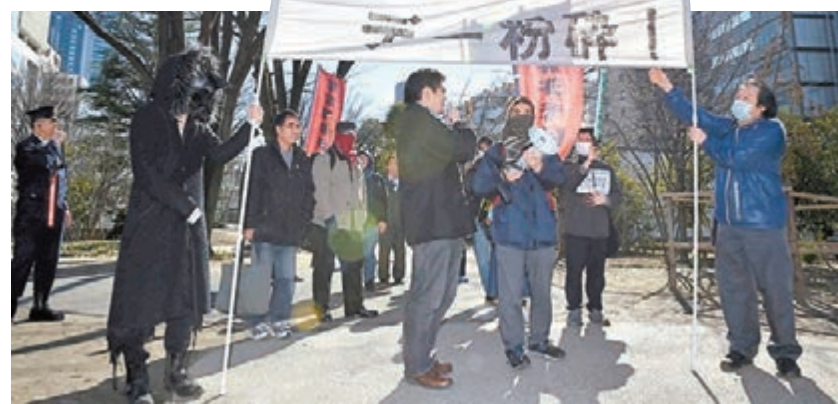
「革非盟」成員上街，表達對情人節引起的戀愛資本主義不滿。

明日就是情人節，在日本大街小巷，到處都瀰漫着甜蜜氣氛，但由一批網民組成的「不歡迎革命同盟」(「革非盟」)，昨日卻走上涉谷街頭，誓言要「粉碎情人節」、推翻將戀愛與消費活動掛鈎的「戀愛資本主義」。約20名示威者高舉「人的價值不由朱古力數目衡量」等標語遊行，不少途人以奇怪目光看待，有女大學生則嘲笑他們是收不到朱古力才示威。