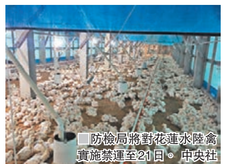
防檢局將對花蓮水陸禽實施禁運至21日。