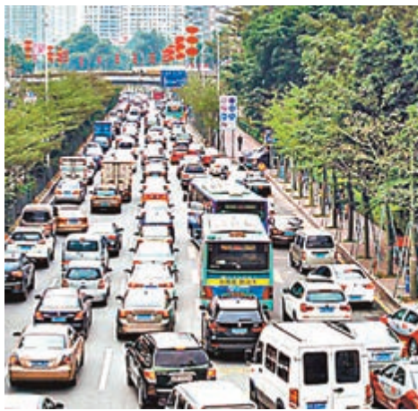
深港東部過境交通要道時常擁堵。網上圖片

記者昨日在東部過境高速公路連接線工程現場看到，該連接線是一條全長6.751公里的東西走向隧道。港人駕車分別有兩個入口可駛入高速：經文錦渡口岸入境的車輛，需經沿河北路，向東進入雙向6車道的分離式隧道；經深圳市區北環大道車輛，則需在愛國路立交處進入雙向4車道的分離式隧道。2018年建成後，港人經蓮塘口岸將可無縫連接東部過境高速。 隨着深圳市內汽車保有量及道路車流量的快速增長，布心、愛國、沿河路等深港東部過境交通要道時常擁堵，早晚高峰通過丹平快速前往龍崗方向的車輛時常排隊一兩公里，已嚴重影響兩地居民出行。深圳市委表示，建成後東部方向的香港跨境貨運交通將調整至東部過境高速公路，分別由口岸連接線接入蓮塘口岸，由市政連接線接入文錦渡口岸，實現過境交通與城市交通以及片區交通的分流，從而避免擁堵，改善交通狀況。