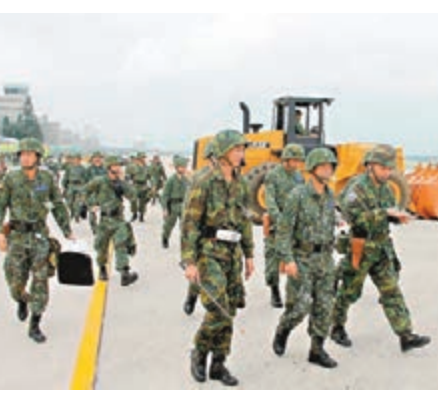
5月的漢光演習只會作兵棋推演。圖為去年的漢光演習。資料圖片

香港文匯報訊 據中社社報道，台軍2017年的漢光演習將不再有實兵演練，僅進行兵棋推演(模擬演練)了解戰力，2018年才進行實兵演習。據報道，蔡英文去年8月25日首次視導漢光演習後表示，現階段的台軍需要一套確認方向、改變文化的軍事戰略，已責成防務部門在今年1月完成初稿。 據防務部門人士透露，今年5月將進行漢光演習的兵棋推演，了解各部隊的戰力，兵推中所獲得的數據，將用於各軍種年度的操演中，等三軍各級部隊都完成驗證後，才會在2018年進行實兵演習，故今年不辦實兵演習。