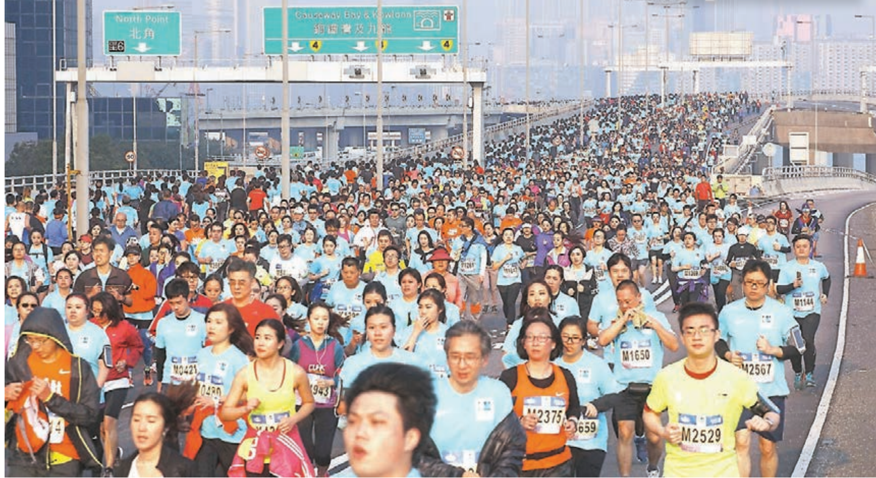
渣馬各項賽事的選手達63,532名。

「渣打香港馬拉松2017」昨日清晨起在港九舉行各組別包括全馬、半馬及10公里等賽事,不少跑手在天未亮時已出動至起點就位,令平時寧靜的街道變得如嘉年華般熱鬧及充滿活力。