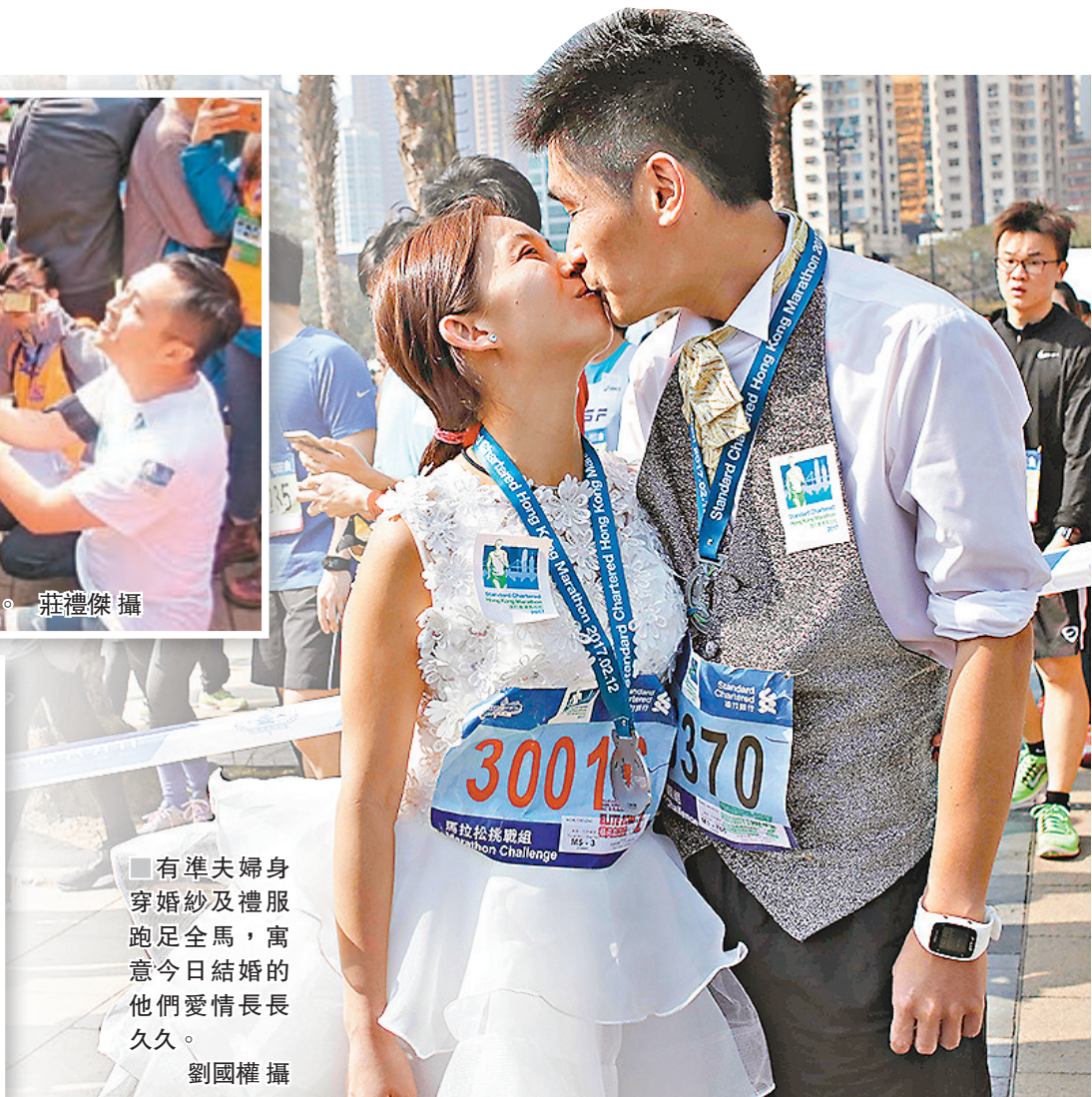
有準夫婦身穿婚紗及禮服跑足全馬,寓意今日結婚的他們愛情長長久久。

有別於去年馬拉松愈跑愈大雨,今年天公作美,清晨開跑時天氣清涼乾燥,不少參加者大讚天氣適合跑步。賽道上穿着禮服及婚紗的馮生及準馮太太成為全場焦點,在跑畢全馬後於終點接受傳媒訪問,指他們因馬拉松結緣,昨日是第二個一起完成的賽事,特意挑選昨日賽事為愛情長跑的尾聲,指為方便宴招待外國跑友會在今日成婚。