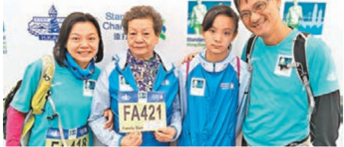
85歲的何婆婆與女兒、女婿及外孫女一同參賽。

二人亦大讚大會起點安排工作人員帶領一眾參加家庭熱身,令氣氛更熾熱,惟指部分賽道與半馬選手相遇,擔心會妨礙較專業的組別作賽,然而賽事未有擠塞。被問及明年會否再次參賽,姑媽表示要姪女肯肯才能成事,而連小朋友則說會考慮。