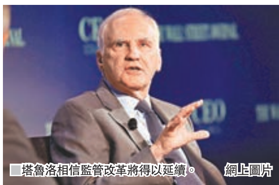
塔魯洛相信監管改革將得以延續。

任期原定到2022年才結束的美國聯儲局理事塔魯洛，前日突然辭職，令市場震驚。塔魯洛被視為聯儲局金融監管措施的「首席工程師」，對華爾街有巨大影響力，由於總統特朗普一周前剛下令檢討監管條例，市場自然猜測與塔魯洛的辭職有關。塔魯洛將於4月初左右離任，屆時聯儲局7個理事席位中，將有多達3席空缺，意味特朗普將可以加快為聯儲局「換血」的步伐，透過安插更多親信入局，進一步控制金融業監管和貨幣政策走向。