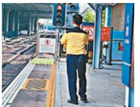
發現路軌出現裂縫的港鐵大圍站。

香港文匯報訊（記者 杜法祖）港鐵事故層出不窮。東鐵線大圍站昨日上午由於有路軌出現裂縫，列車服務一度受阻，經過約一小時臨時鞏固工程後，中午過後列車運轉初步證實安全，列車服務陸續恢復正常。港鐵表示，待晚上收車服務時段結束後，職員將更換有關路軌。