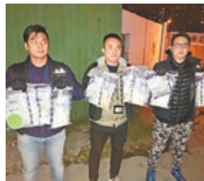
警方展示檢獲包裝工場起出的懷疑K仔毒品。

16歲女生淪毒販 經搜查後，當場檢獲約6.5公斤重懷疑氣胺類毒品（K仔），市值約