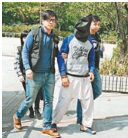
警方在沙田禾峯邨拘捕涉嫌非禮案青年。

香港文匯報訊（記者 杜法祖）一名非華裔青年，涉嫌於本月和去年12月，於沙田火炭站附近街頭，分別從後非禮兩名21歲及20歲少女，警方接報後相信兩宗案件屬同一人所為，再翻查閉路電視及八達通等資料後，卒鎖定目標，前晚於沙田禾峯邨拘捕涉案青年，並在他住所內檢獲犯案時穿著的衫褲，以及曾使用過的八達通。