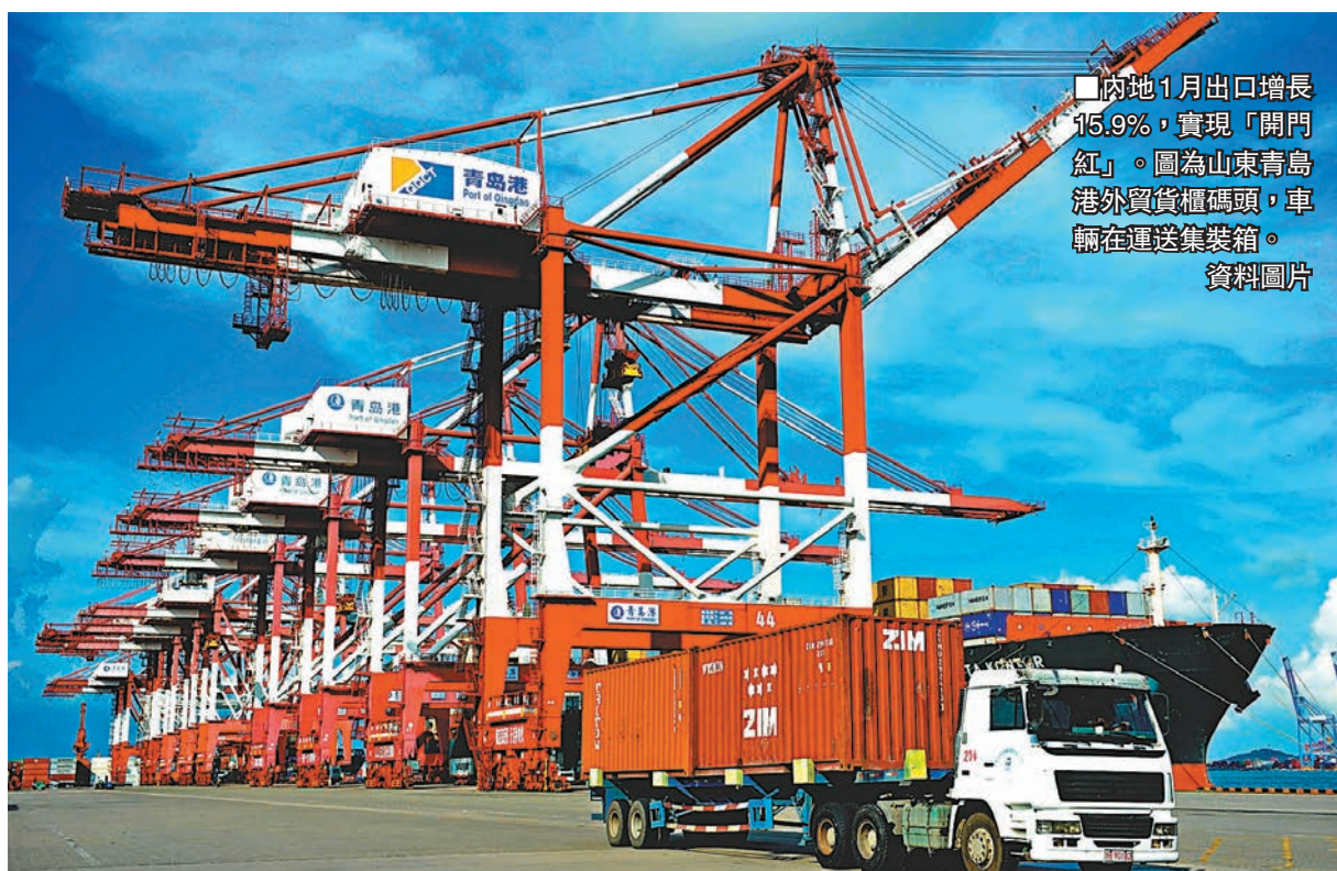
內地1月出口增長15.9%，實現「開門紅」。圖為山東青島港外貿貨櫃碼頭，車輛在運送集裝箱。 資料圖片

香港文匯報訊(記者馬琳北京報道)中國外貿迎來「開門紅」。據海關總署昨日發佈數據顯示，按人民幣計價，今年1月，中國進出口同比大增19.6%。其中，出口增長15.9%，進口增長25.2%，雙雙超過市場預期。業內人士分析認為，儘管1月數據受去年基數較低以及春節因素影響，但整體看，中國外貿延續了去年下半年以來的回穩勢頭，預計二季度中國出口壓力有望進一步緩解。