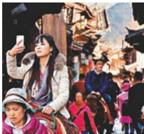
針對節前「遊客在麗江被打事件」，雲南省副省長陳舜帶隊到麗江進行處置。圖為麗江大研古鎮。 資料圖片