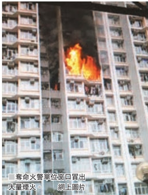
奪命火警單位窗口冒出大量煙火。

麥美娟指雖然起火原因有待調查，但仍提醒街坊須注意家居防火安全，尤其是天氣轉冷，在使用電暖爐、電暖氈時要小心電源及插座的負荷問題。