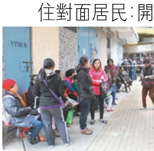
蔭樓逾百住客逃至地下暫避。