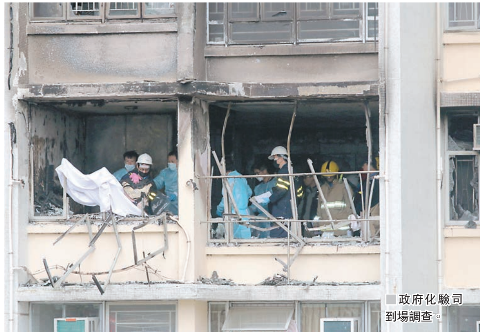
政府化驗司到場調查。