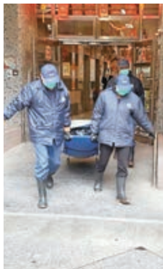
被燒焦老婦遺體昇送殮房。