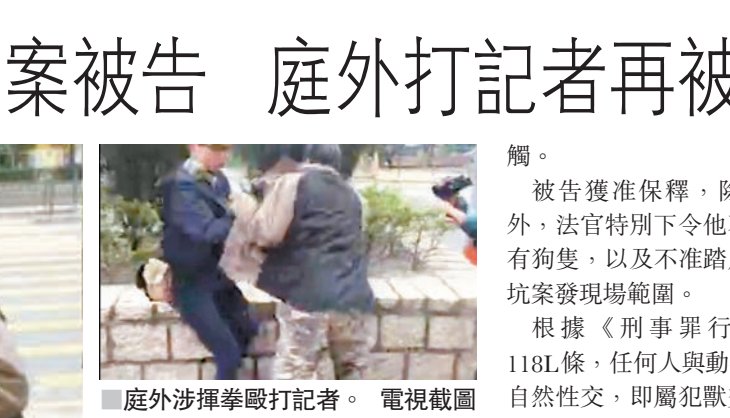
獸交案疑人離開法庭後，涉襲擊記者。