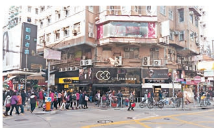
元朗教育路2至6號地下B號舖連閣樓,成交價約9,500萬元。

香港文匯報訊(記者 梁悅琴)元朗為近年新興新市鎮,不少投資者積極尋找入市機會。麥氏投資者過去3個月間更先後購入3個核心地舖,並由中原(工商舖)促成,分別位於元朗教育路2至6號地