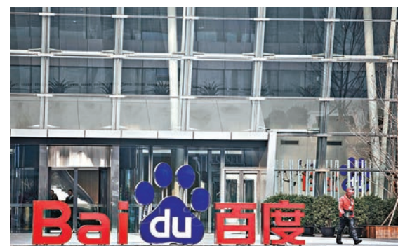
百度部分醫療團隊將轉入人工智能和搜索團隊。 資料圖片

香港文匯報訊 百度昨日表示，將關閉部分醫療業務，部分醫療團隊將轉入人工智能和搜索團隊。人工智能團隊將尋求開發可用於醫療領域的應用，比如藥品研發、測試、基因測序和病人診斷等。其他健康業務部門將被關閉，員工將根據公司發展需要內部轉崗。