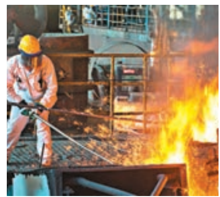
■印尼工人在「一帶一路」重點項目中印尼合作青山工業園區工作。資料圖片

「亞投行」全稱「亞洲基礎設施投資銀行」，是由國家政府發起的區域多邊合作機構。創始成員國各自出資，向亞洲各國提供貸款，對基礎設施，包括交通、電力、農業、水利等設施建設提供資金支援。「亞投行」理事會成立大會於2016年1月16日舉行，宣佈正式開業運行。現時國家為最大出資國家，擁有「亞投行」25%至20%的投票權，相信此舉能賦予發展中國家更多的發言權和參與權，藉此改變由美國領導的金融秩序以及改善其裙帶的不平衡問題，釋放出亞洲以及「一帶一路」沿線國家的更大的經濟動力。