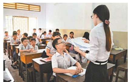
東埔寨金邊學生學習中文。

近幾年來，新興市場成為國際經濟發展上的一枝獨秀，國民生產總值(GDP)增幅按年比不少發達國家要高。國家提倡「走出去」方針，借用古代「絲綢之路」的歷史任務，主動與沿線國家，包括東亞、東南亞、中亞、西亞、非洲以及歐洲等國家發展良好經濟貿易關係，打造彼此間政治互信、設施聯通、文化包容等多面向合作。