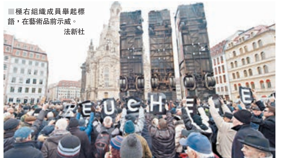
■極右組織成員舉起標語，在藝術品前示威。