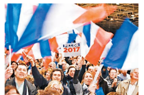
■菲永支持者早前出席造勢大會。