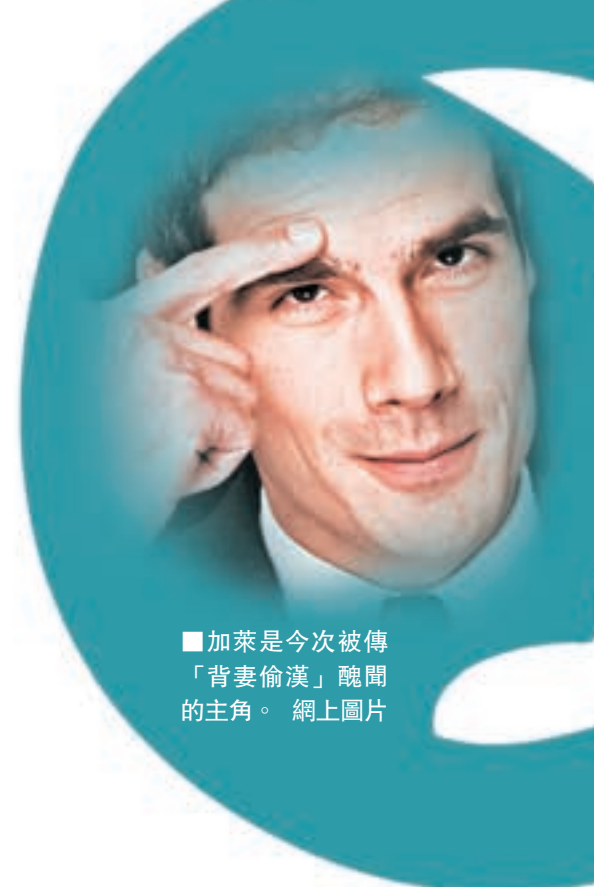
■加萊是今次被傳「背妻偷漢」醜聞的主角。

以公帑聘用妻兒出任議員助理，最先揭發醜聞的《鴨鳴報》前日再爆料指，菲永妻子佩內洛普完成兩份合約後，合共向她支付4.5萬歐元(約37萬港元)遣散費，超出法例容許上限。中間派前進黨的馬克龍則被指背着妻子，與法國電台台長加萊搞同性婚外情。馬克龍隨即高調反駁，其團隊聲稱該消息是政敵攻訐。