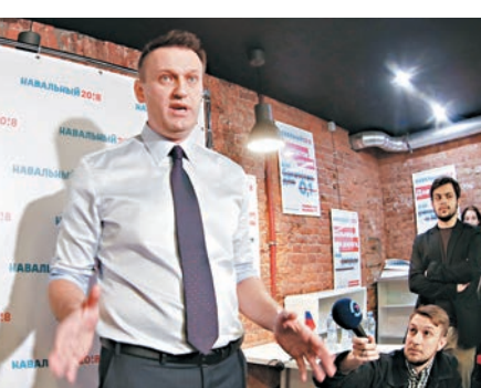
■納瓦爾尼質疑所謂重審只是門面工夫。

俄羅斯反對派領袖納瓦爾尼昨日被法院裁定挪用公款罪成，判處緩刑5年。納瓦爾尼日前宣佈將會參加2018年總統大選，被視為總統普京角逐連任的一大威脅，納瓦爾尼罪成後可能會被禁止參選，但他昨日堅持繼續選舉工程，並表明會上訴。