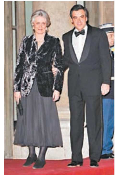
■菲永近日頻頻回應以公帑向妻子支薪的指控。網上圖片