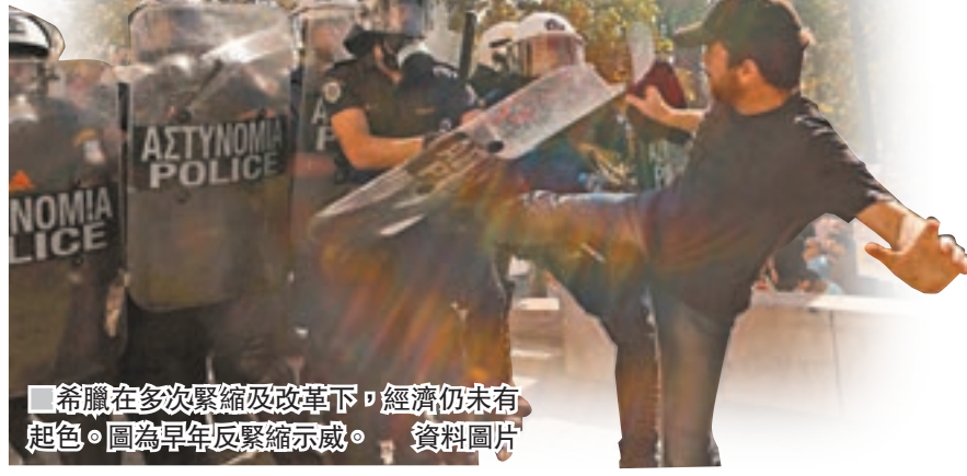
希臘財政再次陷入危機，恐再次觸發警民衝突。資料圖片

國際貨幣基金組織(IMF)昨日發表分析報告，認為希臘在多次緊縮政策及經濟改革下，經濟仍未有起色，警告該國債務未來可能有「爆炸性」增長，甚至再次引發希臘可能退出歐元區的危機。由於IMF與歐盟就希臘經濟改革的看法分歧，前者自2014年起停止向希臘提供第二輪援助，並於去年初正式中止援手，最新報告則顯示在可見將來，IMF都不會批出第三輪援助，意味歐盟要繼續獨自承擔援助希臘的重擔。