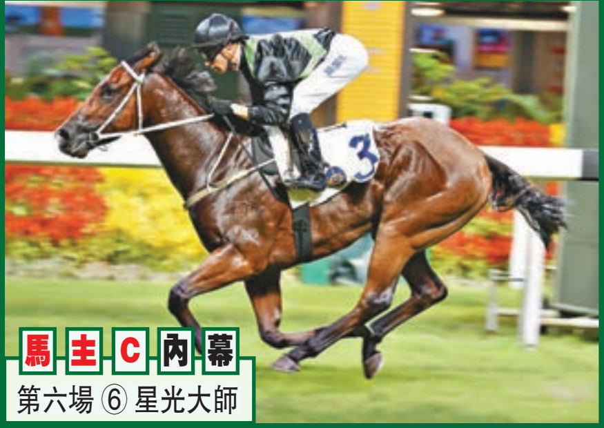
馬主C內幕第六場 ⑥ 星光大師

第六場、第三班、一二〇〇米。「星光大師」五歲當紫短途之輩，季初評六十一分即在谷草千二跑入第三，可惜打後多戰此程皆與頭馬無緣，直到上仗續