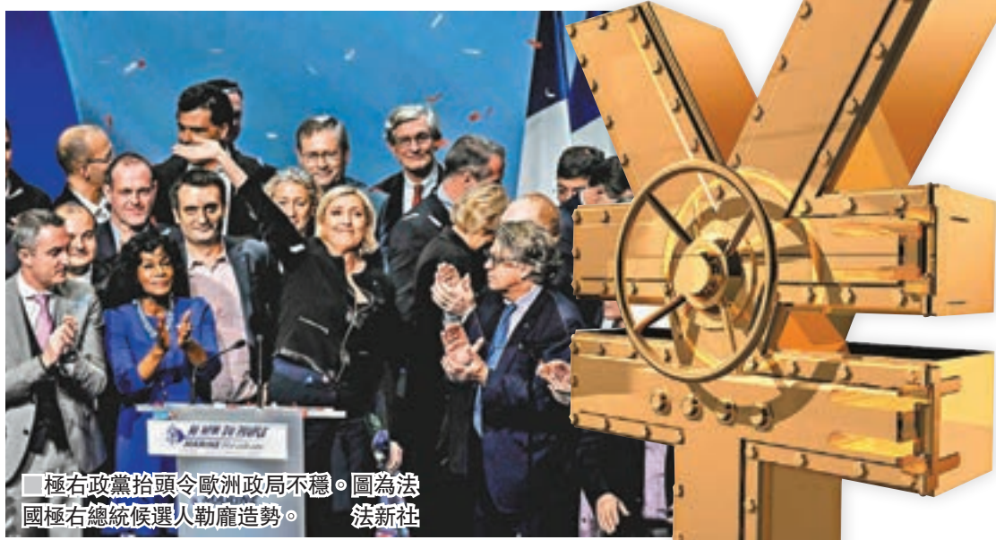
極右政黨抬頭令歐洲政局不穩。圖為法國極右總統候選人勒龐造勢。

歐洲多國今年將舉行大選，極右政黨抬頭令政局不穩，加上美國總統特朗普上任以來政治風波不斷，資金湧向日圓和黃金避險。日圓兌一籃子貨幣的匯價昨日急升，兌美元及歐元曾觸及兩個月高位；兌港元曾升至6.95算。「日圓先生」神原英資預計，美元兌日圓或會在年內跌破100大關。