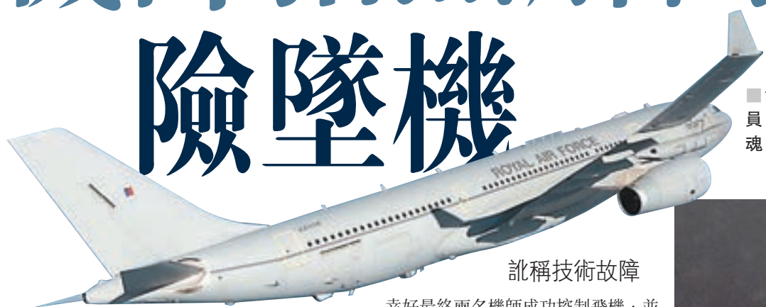
187名空軍人員經歷空中驚魂。

英國皇家空軍一名機師2014年2月駕駛載有187名空軍人員的飛機，由英國飛往駐阿富汗英軍軍營途中，涉嫌在駕駛艙內拍攝機外風景，誤觸飛機控制桿，令機身急速向下俯衝約4,400呎，致機上14人受傷。他事後訛稱技術故障，被控作偽證及偽造飛行記錄，他否認控罪。