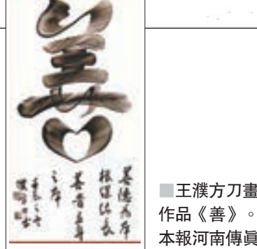
■王濮方刀畫作品《善》。