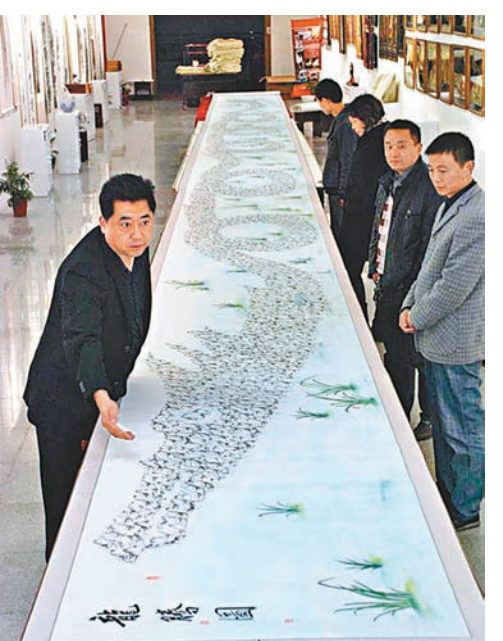
■刀畫《龍騰圖》。