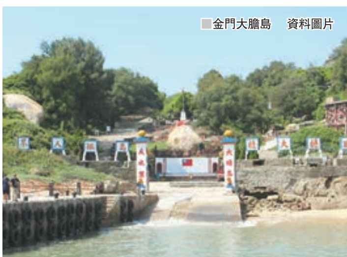
■金門大膽島 資料圖片

香港文匯報訊 據中央社報道，被視為「兩岸前線秘境」的台灣離島金門縣轄下大、二膽島（大陸稱大擔、二擔島），有望今年正式對外開放旅遊。金門縣政府日前舉辦為期近兩個月的「大膽島文創商品設計競賽」，邀請設計師運用島上特有的軍事遺蹟及地景意象為元素，創作紀念商品。觀光處表示，未來獲獎作品將做成限量紀念商品在島上販售。