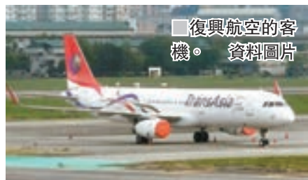
復興航空的客機。資料圖片

香港文匯報訊 據中央社報道，復興航空去年11月停飛並解散，11架自有飛機正由債權銀行團拍賣中，與航提供的參考售價是3億美元。不過，民航界人士推估要賣到參考價的一半可能都困難，因為2架最值錢的A330飛機，目前市場過剩。與航停飛前，共有27架飛機，其中16架租賃機已由租賃公司取回，11架自有飛機由債權團取得共識，公開拍賣，銀行團希望2月底前能全部出售。與航11架自有機包括：2架廣體客機A330-300、2架單走道客機A320及A321、7架螺旋槳客機ATR。除了11架飛機外，銀行團也拍賣與航留下的發動機等航材，參售價是新台幣20億元。