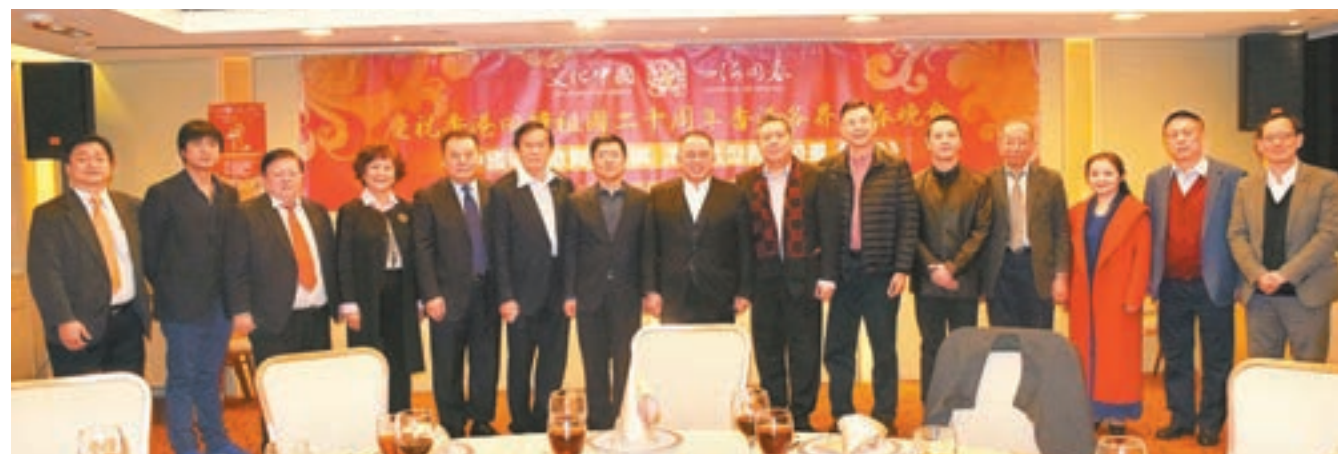
香港僑界社團聯會於歡迎宴上與藝術團代表合影。

香港文匯報訊(記者 李擘)由國務院僑辦和香港僑界社團聯會主辦的「文化中國·四海同春」新春晚會，將於2月9日、10日兩晚於紅館隆重上演。香港僑界社團聯會昨日假銅鑼灣世貿中心設宴，歡迎蒞港演出的藝術團成員。