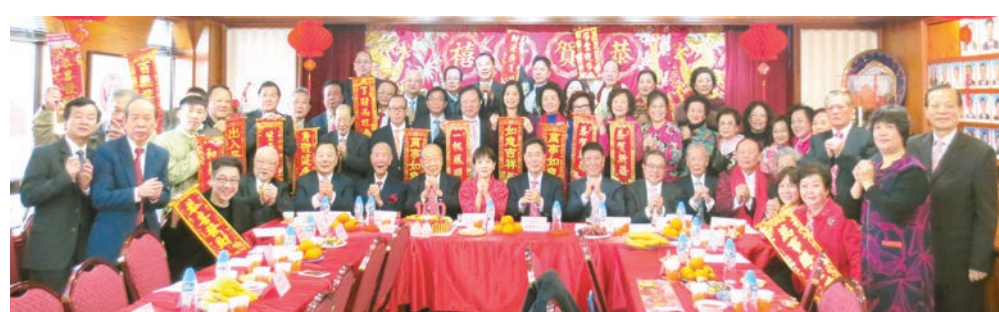
潮商互助社首長同仁和嘉賓喜慶新禧。