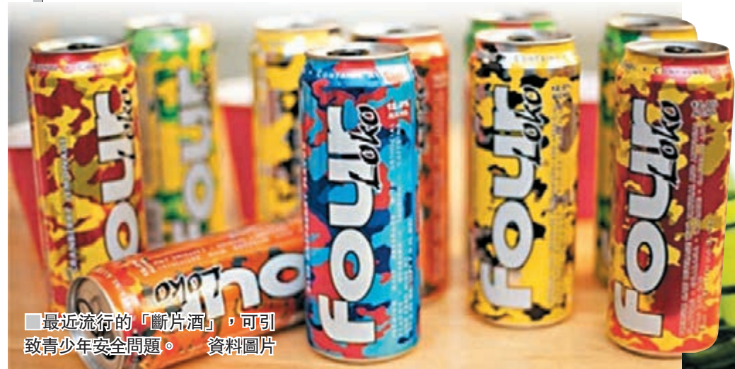
■ 最近流行的「斷片酒」，可引致青少年安全問題。

根據香港海關的進/出口清關手續，現時香港對「在攝氏20度的溫度下量度所得酒精濃度以量計不多於30%的酒類」以及葡萄酒豁免稅項，但對於烈酒的稅率則以酒類價值等值徵稅。