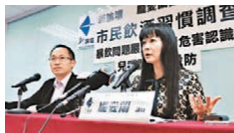
■ 有調查指未成年人買酒容易。

除了為滿足好奇心外，更重要的是在朋友前建立形象。青春期的少年反叛心理較強，喜歡挑戰權威，同時亦會模仿成人，因此會在朋輩面前飲酒，以表現自己成熟的一面，並藉共同行為取得對方的信任及認同，但卻因此受影響而失去判斷力，踏入酒精陷阱。