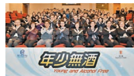
■ 本港制酒宣傳活動。 資料圖片

青少年容易低估酒精對自己的影響，一旦失去節制便可能影響判斷力，嚴重的甚至會失去知覺，可導致車禍、暴力行為、不安全性行為等嚴重事故，對自己以至他人造成傷害。