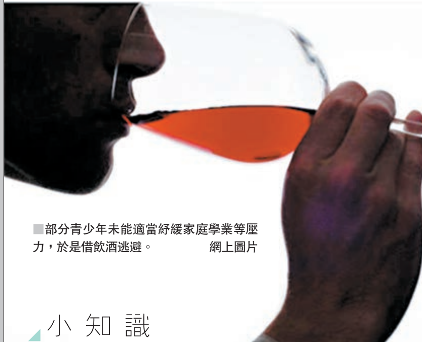
■ 部分青少年未能適當舒緩家庭學業等壓力，於是借飲酒逃避。

然而，香港現時對酒精飲品的管制落後，食環署只限制在店內即時飲用酒精飲品才需要領取酒牌，一般便利店及藥房不需酒牌也可出售酒精飲品，政府亦未有立法禁止售賣酒類予18歲以下人士。