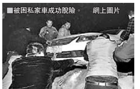
被困私家車成功脫險。