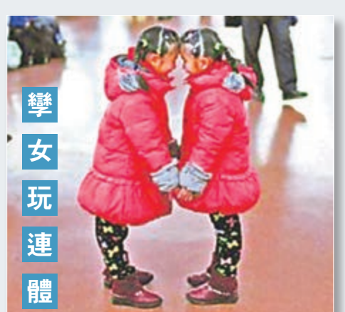
學女玩連體。網上圖片

在湖北漢口火車站母嬰候車室裡，7歲的學生姐妹梓揚和梓帆日前在候車時玩耍。她們隨父母親回老家宜昌過年後返回江蘇連雲港市，在漢口站中轉。