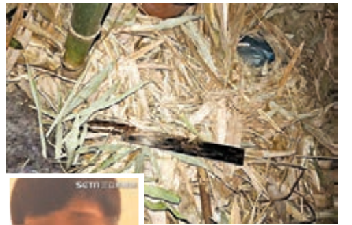
兇器西瓜刀。網上圖片