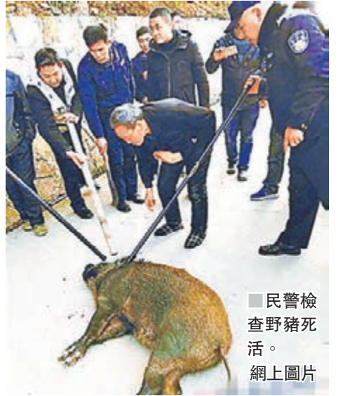
民警檢查野豬死屍。網上圖片