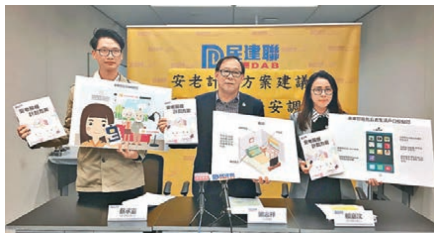
■民建聯調查發現，逾30%受訪長者曾在家中跌倒、暈倒。資料圖片