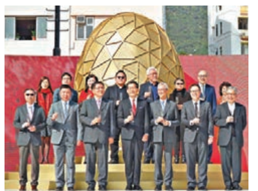
■蘇錦樑在香港電台新春團拜上合照。

香港文匯報訊（記者 聶曉輝）香港電台昨日舉行丁酉雞年新春團拜，擔任主禮嘉賓的香港特區商務及經濟發展局局長蘇錦樑於致辭時表示，回顧猴年，港台在同事齊心努力下，港台電視31A及港台電視33A兩條模擬電視頻道於去年4月2日順利啟播。他續說，港台電視31及港台電視31A每日的廣播時數，亦延長了7.5小時至19小時，為觀眾提供豐富多樣的電視節目選擇，也將港台電視服務的發展開創新一頁。