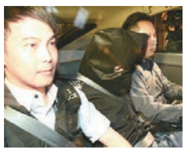
警方搗破網上詐騙集團，其中一名被捕疑人被帶署。

香港文匯報訊(記者杜法祖、鄺福強)警方過去3個月接獲多宗涉及網購詐騙投訴，指有人透過facebook及Instagram等社交平台，訛稱有演唱會、海洋公園門票、二手傢俬等平價貨，及賭波貼士出售，但受害人按指示將款項存入指定銀行戶口後，賣家即失去聯絡，至今共21人受騙，涉案款26萬元。警方經追查後昨日在葵涌葵盛東邨拘捕3名涉案青年，包括一對兄弟，相信已成功搗破該詐騙集團，警方正追查是否尚有其