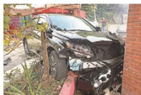
私家車險撞進廟內。

根據資料，西貢蠔涌車公廟傳說是宋朝(公元960年至1279年)一位大元帥，曾平定華南一場叛亂。南宋末宋帝昀南下避難，車大元帥護駕到港，傳駐西貢，大元帥其後被奉為神