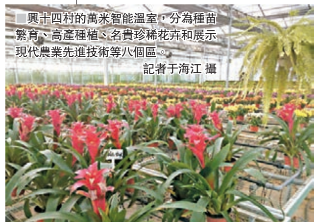
興十四村的萬米智能溫室，分為種苗繁育、高產種植、名貴珍稀花卉和展示現代農業先進技術等八個區。