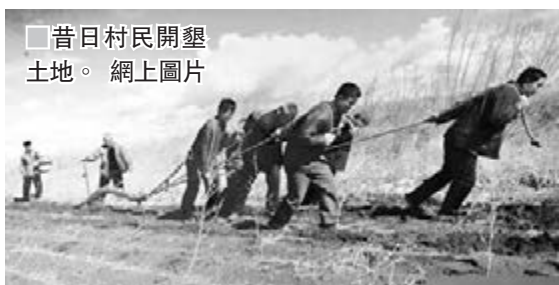
昔日村民開墾土地。網上圖片