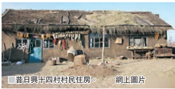
昔日興十四村村民住房。