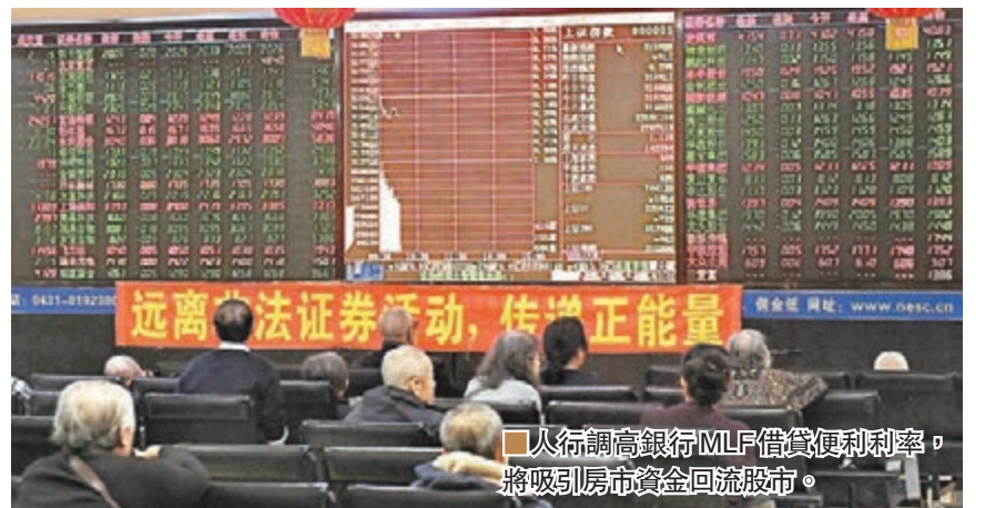
人行調高銀行MLF借貸便利利率，將吸引房市資金回流股市。

鉅亨網投顧表示，中國MLF加息恐衝擊本就偏高的房市及債市，根據牛津經濟學公司的報告指出，北京及上海的房價/所得比皆超過30倍，為全世界房