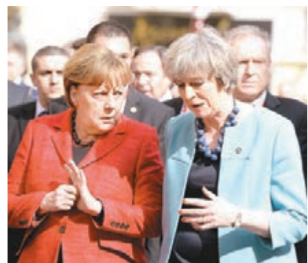
德國總理默克爾(左)與文翠珊在馬耳他峰會密商。

歐盟各成員國領袖昨日在馬耳他舉行非正式峰會，集中討論如何遏止難民潮，並尋求提升民眾對歐盟的支持度，加強歐盟凝聚力，英國脫歐不在峰會議程內。