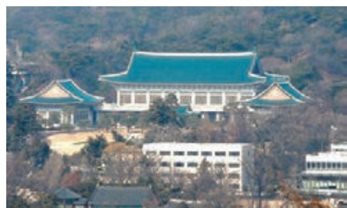
青瓦台以機密為由，拒絕獨檢組入內。

調查韓國總統朴槿惠親信干政案的獨立檢察組，前晚獲首爾中央地方法院批出搜查令後，昨日早上嘗試進入青瓦台搜證，但遭青瓦台以機密為由拒絕。獨檢組其後離開，但稱會向代總統黃教安尋求搜證許可。