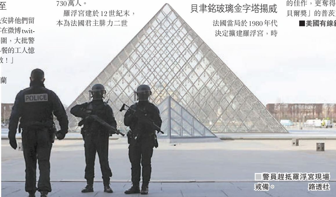
警員趕抵羅浮宮現場戒備。