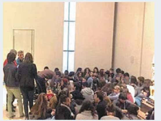
遊客一度坐在羅浮宮內等候疏散。 網上圖片