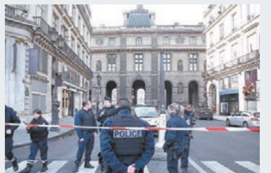
當局緊急封鎖現場一帶，禁止車輛和行人出入。