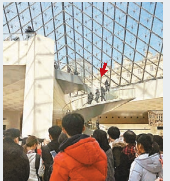
遊客在士兵及警員(箭嘴)帶領下離開羅浮宮。