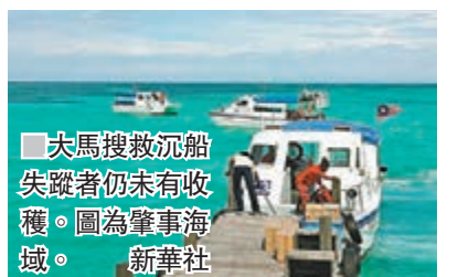
大馬搜救沉船失蹤者仍未有收穫。圖為肇事海域。

香港文匯報訊 據新華社報道，馬來西亞海軍執法局官員昨日說，對沙巴州沉船事故的搜救行動當天繼續進行，仍未發現失蹤者。當天的搜救範圍為2,990平方海里，較之前兩天有所縮小。