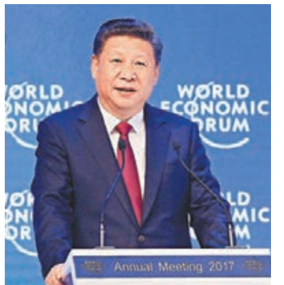
■習近平在達沃斯年會發表講話，宣佈「一帶一路」國際合作高峰論壇。 資料圖片

文章稱，在特朗普時代，東南歐與中國的關係將獲得新的動力。因為在特朗普對世界關上大門並對歐洲汽車生產商威脅說要徵收30%以上進口稅的同時，中國正在消除對外國企業的壁壘。