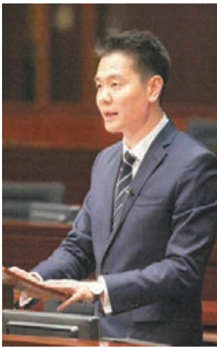
周浩鼎指責反對派凡事拉布,混淆視聽。資料圖片