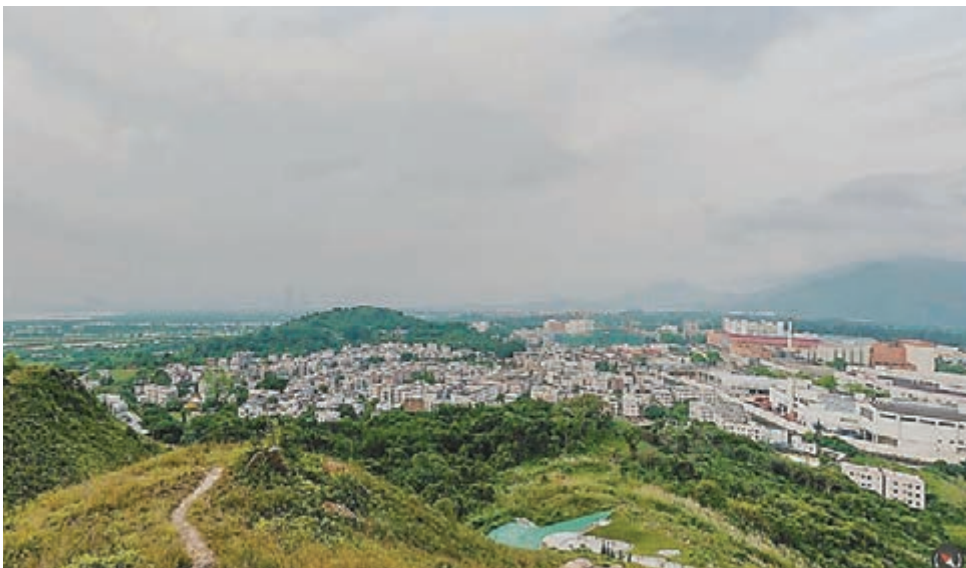
橫洲發展將分三期提供1.7萬個公屋單位,如撥款受阻將全面影響公屋供應。資料圖片

姚松炎提出的休會動議討論了逾一小時後,最終在反對派18票贊成、建制派22票反對下遭否決。小組委員會其後繼續審議申請,但至會議結束時仍未作出表決。下次會議將於本月15日進行。