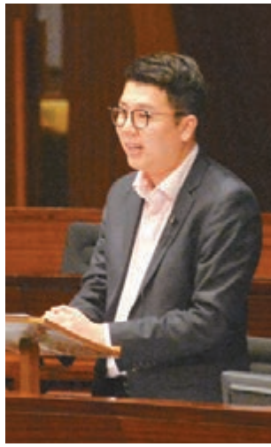
劉國勳批姚松炎未討論就提出休會。