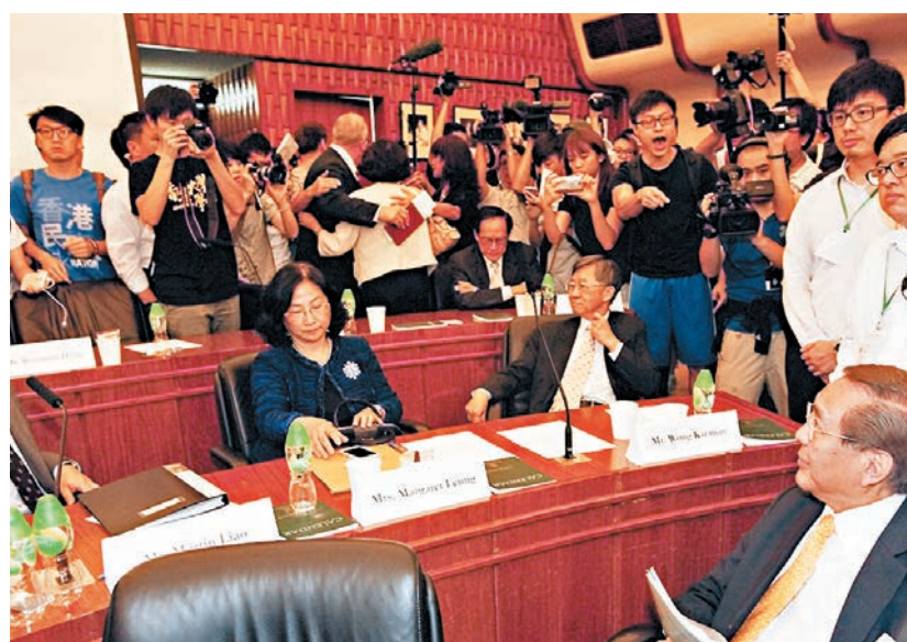
李國章強調，馬斐森辭職與早前政治風波無關。圖為2015年衝擊校委會事件。資料圖片

教育局昨晚回覆傳媒查詢時指，尊重馬斐森個人意願，而聘任校長屬大學自主事宜，相信港大校委會將盡快選出合適的人出任新校長。