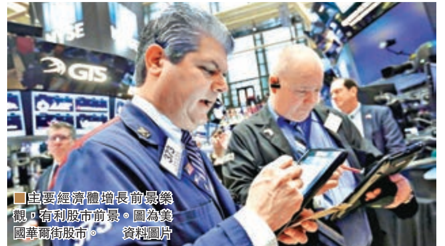
主要經濟體增長前景樂觀,有利股市前景。圖為美國華爾街街市。

他指出,各資產類別方面,對股市展望上調至正面。鑑於環球經濟復甦,以及市場預期各國將會實施更多