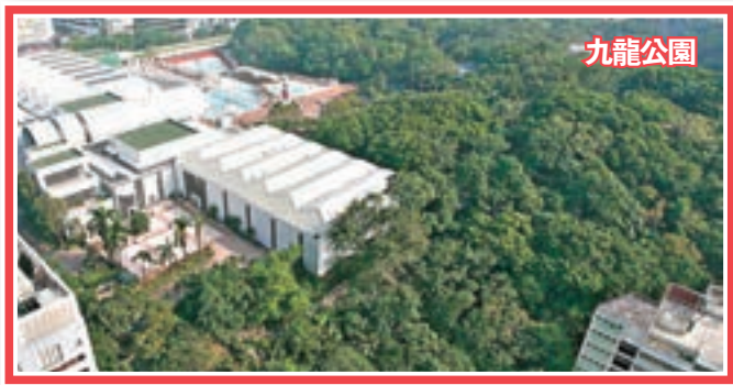
第一策略性地區：尖沙咀西