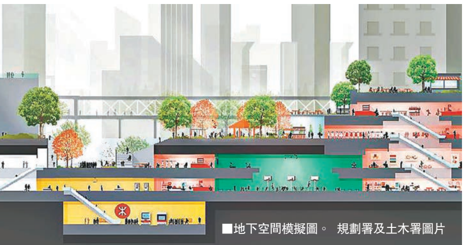
地下空間模擬圖。