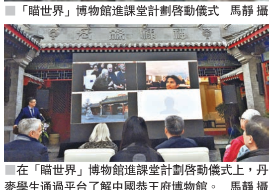
■在「瞄世界」博物館進課堂計劃啟動儀式上，丹麥學生通過平台了解中國恭王府博物館。