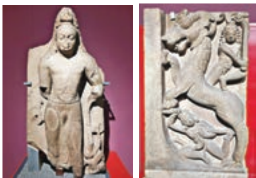
■彌勒菩薩 5世紀 淺黃色砂岩 藏於印度北方邦薩爾納特考古博物館

印度駐廣州總領事唐施恩(Y.K.Sailas Thangal)稱，中國與印度兩大文明古國在漫長的歷史中，文化互相影響，中印兩國在人類文明發展進程中都作出重要的貢獻。福建博物院「梵天東土 並蒂蓮華：公元400-700年印度與中國雕塑藝術展」展期：1月25日至5月30日。