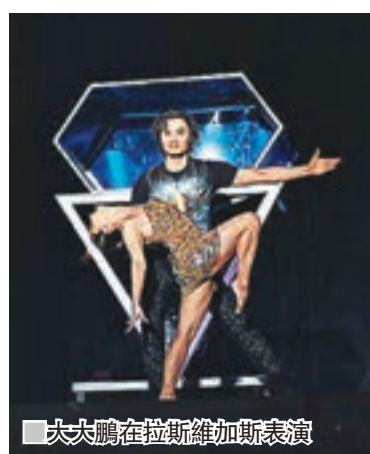
■夫夫鵬在拉斯維加斯表演