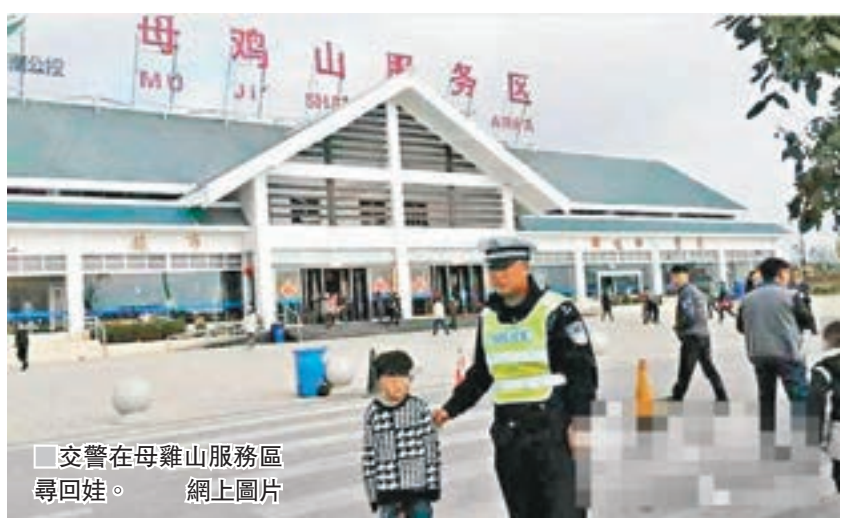
交警在母雞山服務區尋回娃。

後來幾經核實，這正是丟失的孩子。不過，他早晨穿的黑色羽絨外套還放在車輛後排座上。原來在這個服