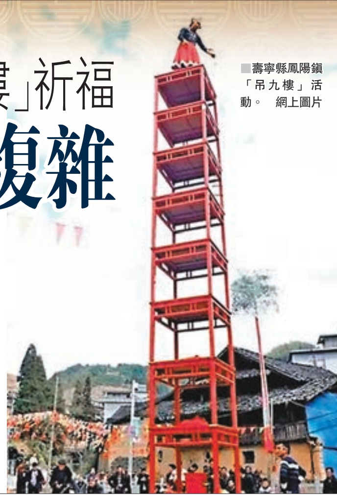
壽寧縣鳳陽鎮「吊九樓」活動。網上圖片

說起「吊九樓」的來歷，還是源於一個久遠的漢族民間傳說。那是在2,226年前，秦始皇造萬里長城時，孟姜女千里尋夫到長城腳下，在得知丈夫在修建過程中死於非命後，嚎啕大哭，並搭台登高為其喊冤和超度亡魂，致使長城也為此感動而轟然倒塌。此後，這樣一個漢族民俗就在江南流傳，其表現形式就是「吊九樓」。