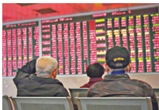
■ A股猴年收官不負眾望,三大指數齊造好。