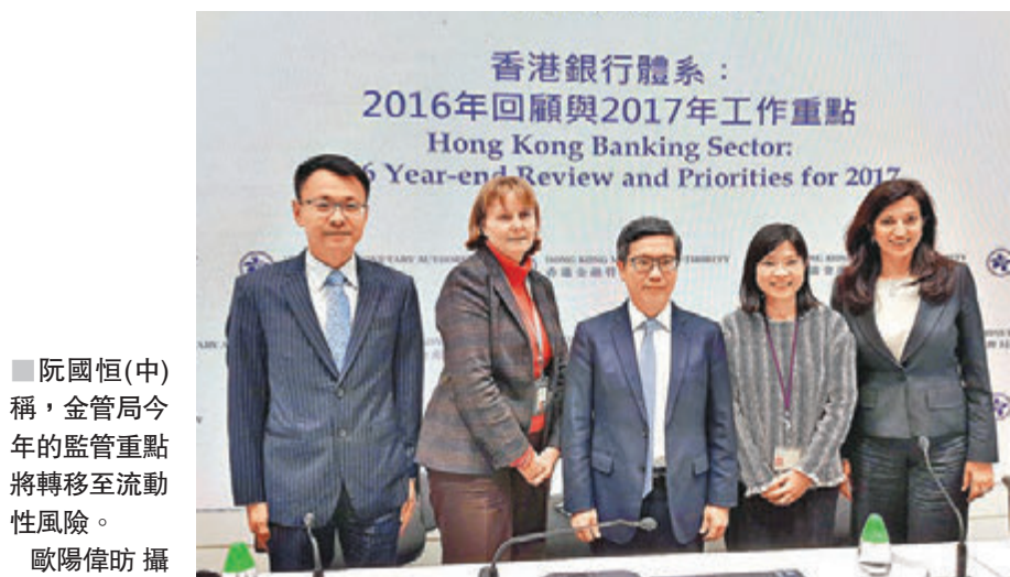
■ 阮國恒(中)稱,金管局今年的監管重點將轉移至流動性風險。

香港文匯報訊(記者 歐陽偉昉) 2016年發生多個「黑天鵝」事件,引起債信、匯市波動。不過,金管局副總裁阮國恒昨在記者會表示,銀行業表現依然理想,零售銀行稅前盈利增長8.7%。淨息差為1.32%。展望今年,若美國加息步伐超預期有機會令資金加快流出,故金管局的監管重點將轉移至流動性風險。