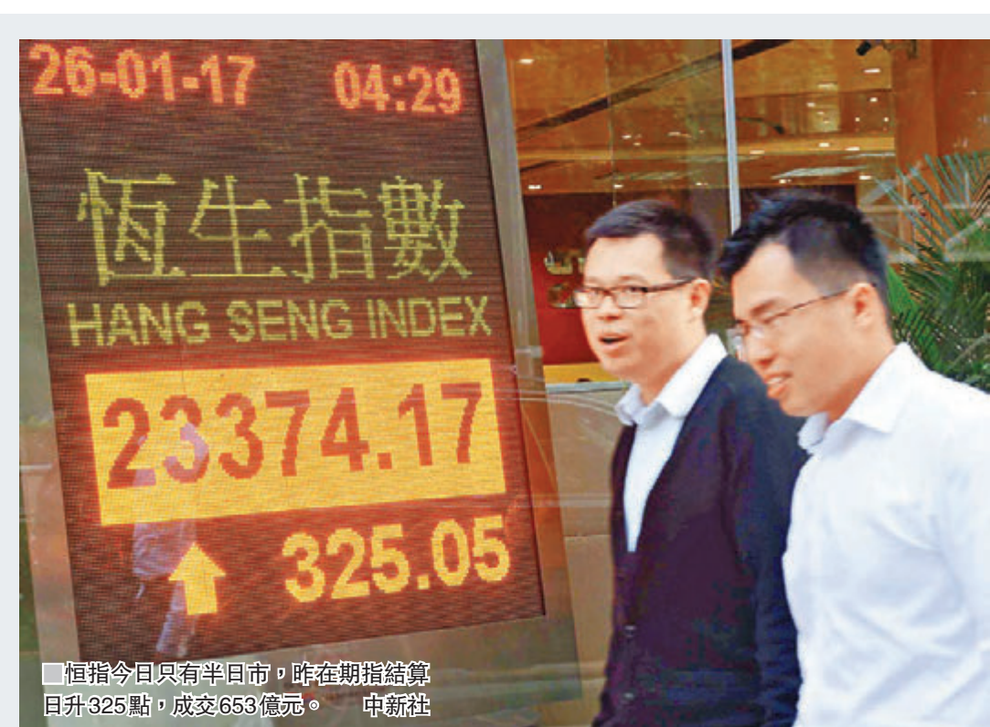
恒指今日只有半日市,昨在期指結算日升325點,成交653億元。中新社