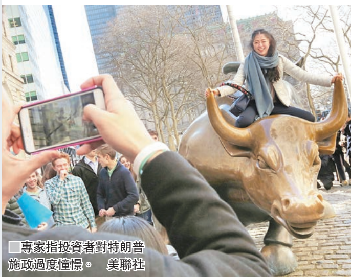
專家指投資者對特朗普施政過度憧憬。