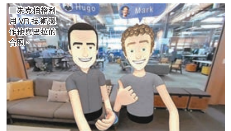
扎克伯格利用VR技術製作他與巴拉的合照。