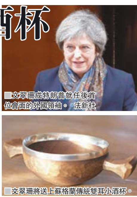
文翠珊成特朗普就任後首位會面的外國領袖。