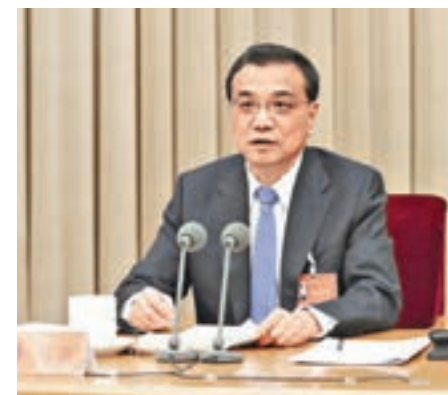
李克強表示，將不斷完善營改增改革，確保各行業稅負只減不增。資料圖片

「在一個不確定性層出不窮的世界上，中國是穩定之錨、增長之源，並始終如一傳遞深化改革、擴大開放和推進自由貿易