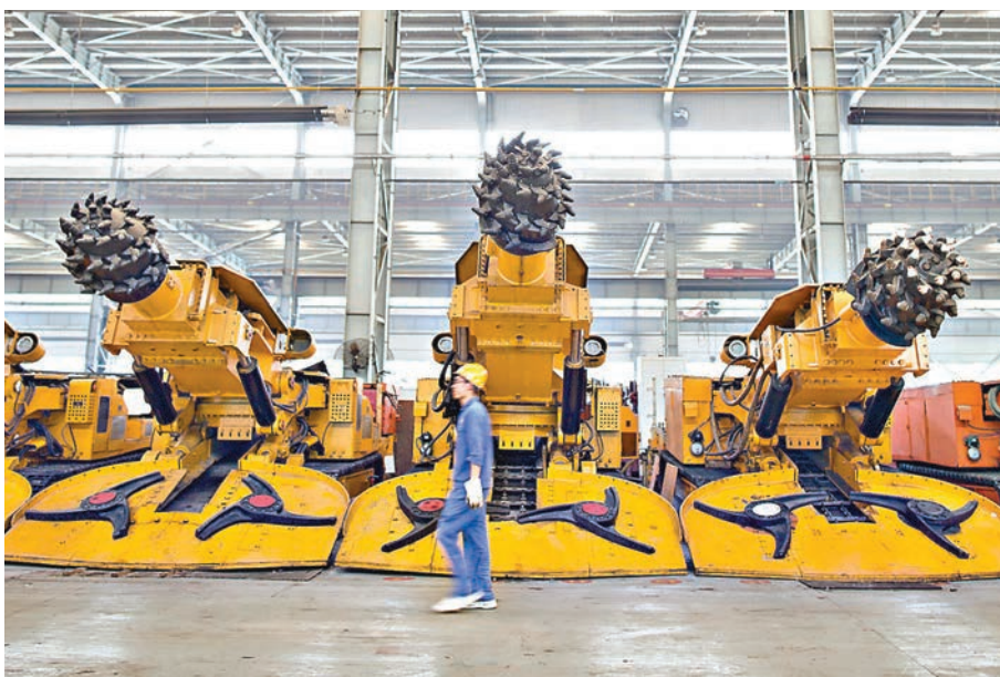
內地去年全年規模以上工業企業利潤實現同比增長8.5%。圖為山西太重工人檢查掘進機。資料圖片

展望今年工業利潤情況，申萬宏源首席宏觀分析師李慧勇分析指出，一方面，上游價格上漲擠壓製造業利潤，細分行業中，煤炭、黑色冶煉、黑色礦採、化纖、有色等改善明顯，石油加工、金屬製品、燃氣、專用設備、計算機等惡化；另一方面，國有企業利潤大幅改善，私營企業利