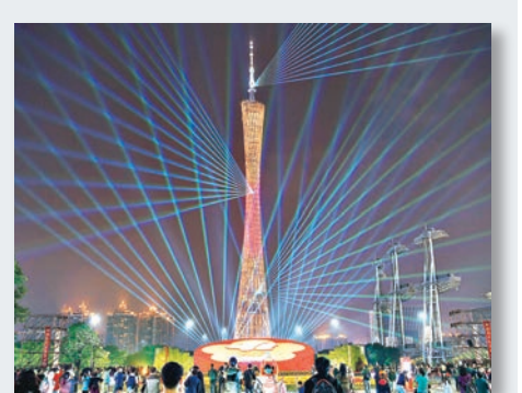
炫彩小蠻腰 臨近春節，位於廣州市的廣州塔上演炫彩燈光秀。

2016年11月30日，聯合國安理會一致通過涉朝鮮的第2321號決議，譴責朝鮮9月9日進行核試驗。根據該決議，2016年12月31日前，自朝鮮進口的煤炭不能超過100萬噸或5,400萬美元。