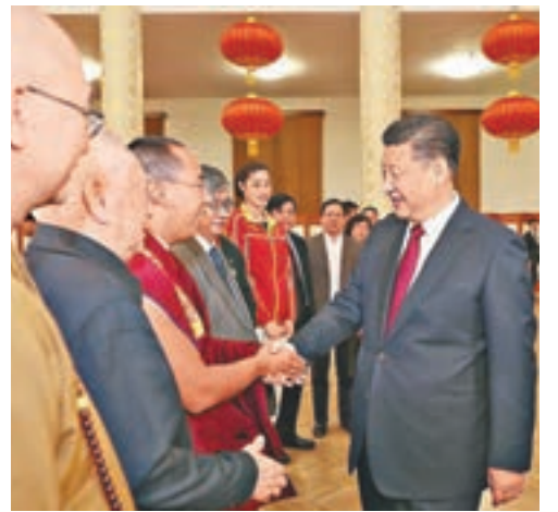
春節團拜會上，習近平同首都各界人士親切握手，互致問候、祝福新春。

習近平指出，真情，需要用社會主義核心價值觀來引領，需要用中華民族傳統美德來滋養。真情，是不虛、不私、不妄之情。真情不虛就是要忠誠老實、誠懇待人，真情不私就是要砥礪品德、剛正無私，真情不妄就是要光明磊落、坦坦蕩蕩。唯有如此，親情、友情、愛情、同志之情才能高尚持久，才能有益於自己，有益於親人、友人、所愛之人、同志之人，也才能鑄就守望相助、天下同心的人間大愛。我們要讓真情大義像春風一樣吹遍神州大地，吹進千家萬戶，給每一個中華兒女帶來溫暖。