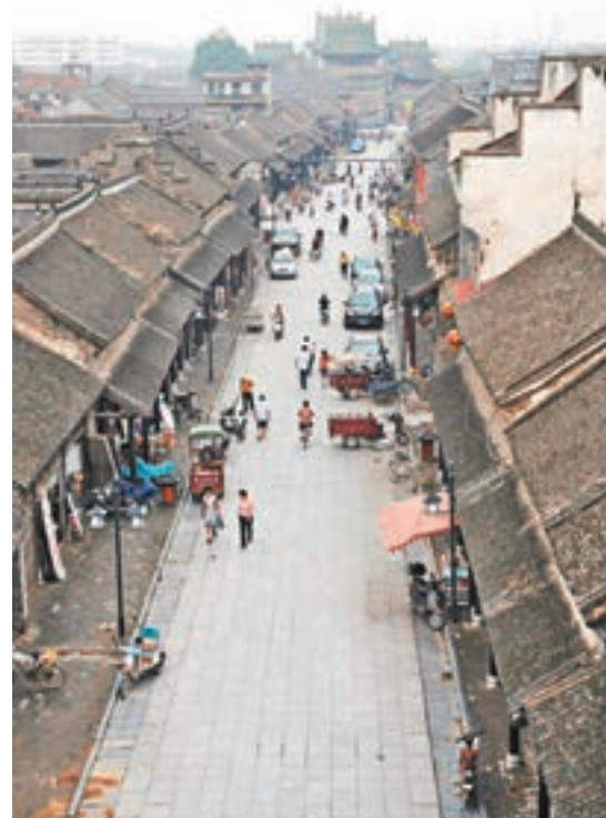
■ 瓷器街鳥瞰，盡頭就是山陝會館。