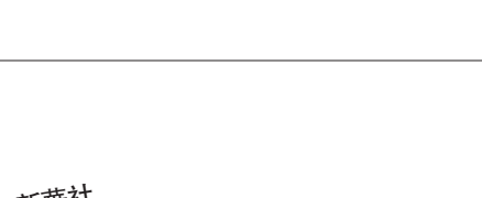
■ 在火神廟可以看到背後的清真寺屋頂