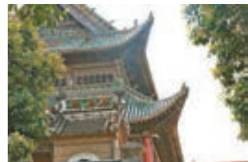
■ 社旗縣城古色古香的琉璃屋檐隨處可見

一條萬成街，分為東萬成街和西萬成街。萬成街從西到東走到盡頭，就轉入南北走向的瓷器街，它們交叉在一起，擁有古鎮保存最完好的古建築。這兩條街還是舊時著名的「金融街」：舊時的錢莊、鏢局、釐金局等金融機構均坐落於此，包括當時有中原第一鏢局之稱的中盛鏢局，現在還在使用的同福客棧以及蔚盛長票號，堪稱當時最富有的兩條街，著名的山陝會館就在北瓷器街的盡頭。