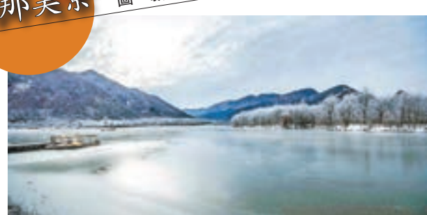
■ 冬日神農架大九湖 神農架大九湖國家濕地公園風光