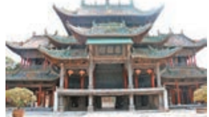
■ 懸鑿樓是當時的戲樓，保存非常好。

整個山陝會館，號稱「無木不刻、無石不雕」，處處有雕刻，每個雕刻中都含有典故和寓意。當時山陝的巨賈以比富的心態，不惜重金聘請能工巧匠，極盡細緻，歷時137年建成。這也難怪原故宮博物院院長呂濟民、副院長單士元曾讚歎其「藝術輝煌，絕無僅有」、「輝煌壯麗，天下第一」，社旗山陝會館也被譽為「天下第一會館」。