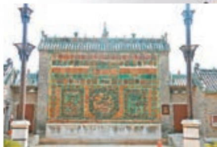
■ 鐵旗杆與琉璃照壁