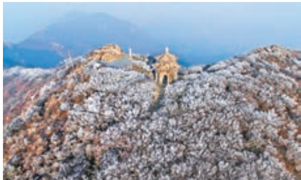
■ 霧海美景 江蘇連雲港花果山霧海