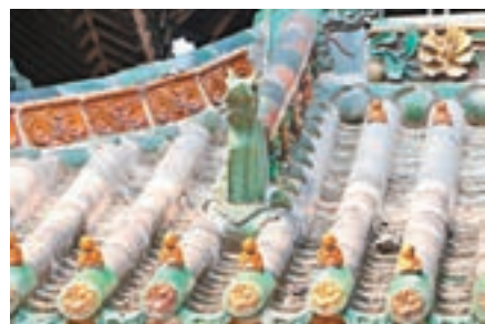
■ 琉璃照壁上栩栩生人與動物雕塑