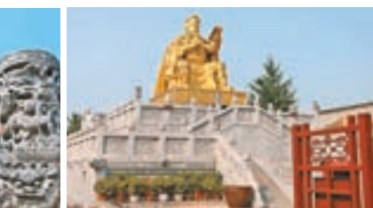
■ 重塑的關羽夜讀《春秋》鑄金雕像

整個山陝會館，號稱「無木不刻、無石不雕」，處處有雕刻，每個雕刻中都含有典故和寓意。當時山陝的巨賈以比富的心態，不惜重金聘請能工巧匠，極盡細緻，歷時137年建成。這也難怪原故宮博物院院長呂濟民、副院長單士元曾讚歎其「藝術輝煌，絕無僅有」、「輝煌壯麗，天下第一」，社旗山陝會館也被譽為「天下第一會館」。