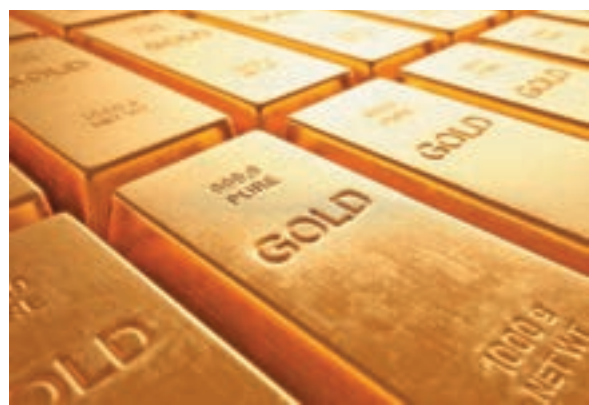
■特朗普宣佈退出TPP，美元回落，金價走勢向好。

紐元：紐元料於71.00至73.00美仙上落。 金價：現貨金價將回軟至1,200美元水平。