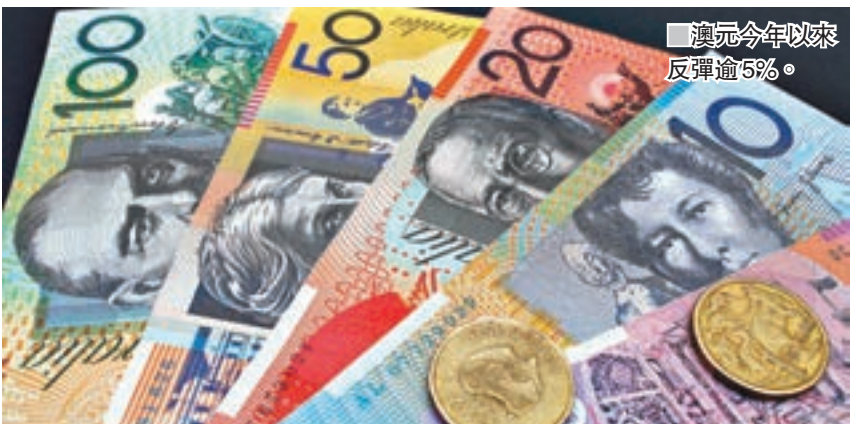
■澳元今年以來反彈逾5%。