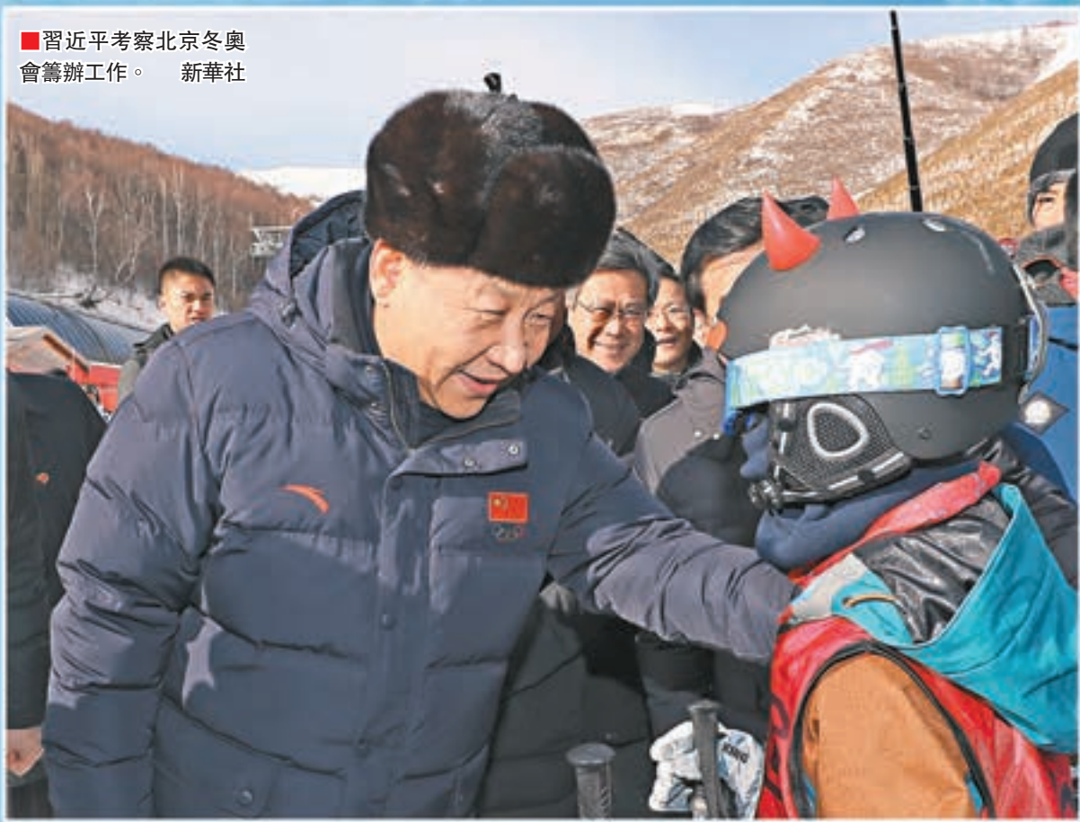
■習近平考察北京冬奧會籌辦工作。新華社

中共中央總書記、國家主席、中央軍委主席習近平日前在河北省張家口市考察北京冬奧會籌辦工作並看望了正在雲頂滑雪場集訓的國家滑雪隊運動員。總書記的親切關懷和重要講話使大家深受鼓舞，大家紛紛表示將牢記總書記的殷切期望和熱情勉勵，奮力拚搏，在2022年北京冬奧會上不負重托、為國爭光。