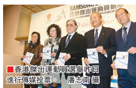
■香港傑出運動員選舉昨午進行傳媒投票。