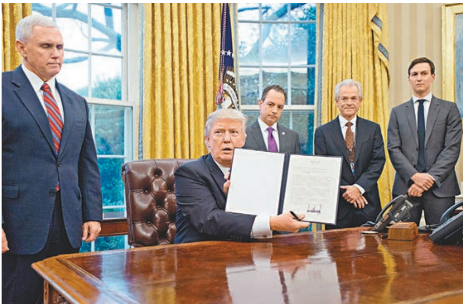
■ 特朗普展示簽署退出TPP的行政命令。