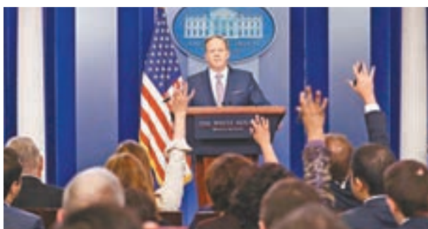
■ 斯派塞在記者會上接受提問。