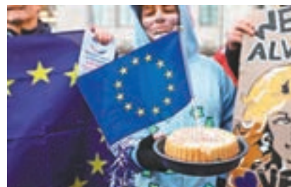
■ 親歐盟示威者在最高法院外，藉蛋糕表達訴求。