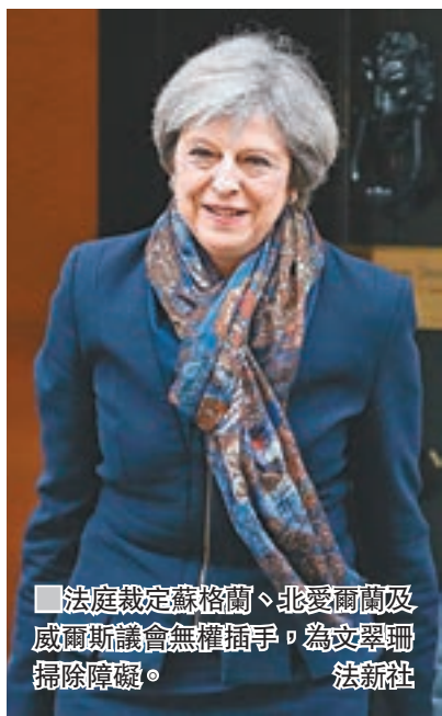
■ 法庭裁定蘇格蘭、北愛爾蘭及威爾斯議會無權插手脫歐事務，為文翠珊掃除障礙。

英國最高法院昨日裁定，政府必須先得到國會同意，才可以啟動《里斯本條約》第50條，展開脫歐程序。在野工黨承諾會遵從民意，不會阻礙脫歐，但揚言要讓英國留在歐洲單一市場，意味首相文翠珊的「硬脫歐」大計或會受阻。不過，法庭同時裁定蘇格蘭、北愛爾蘭及威爾斯議會無權插手脫歐事務，為文翠珊掃除一道巨大政治障礙。