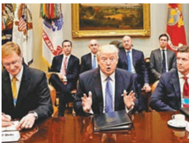
■ 特朗普會晤商界領袖。