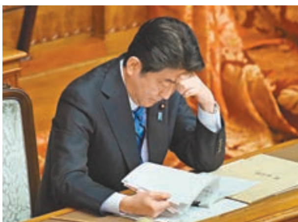
■ 安倍現身國會，就美國退出TPP接受質詢。