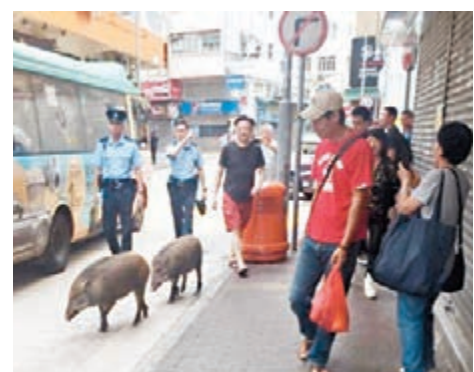
野豬是不是具有攻擊性，可謂見仁見智，圖左為去年11月被野豬咬傷的保安員，而圖右則是去年5月野豬在香港仔「行街」。資料圖片