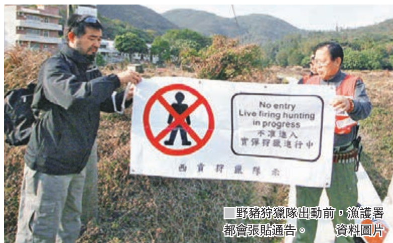
野豬狩獵隊出動前，漁護署都會張貼通告。

去年11月16日，漁護署在西貢壁屋村張貼通告，野豬狩獵隊會在翌日(17日)出動獵殺野豬，引來社會關注。這次的事件，原因是野豬在西貢壁屋村覓食，令垃圾四散，影響衛生之餘，村民亦害怕野豬傷人，因此向漁護署求助。