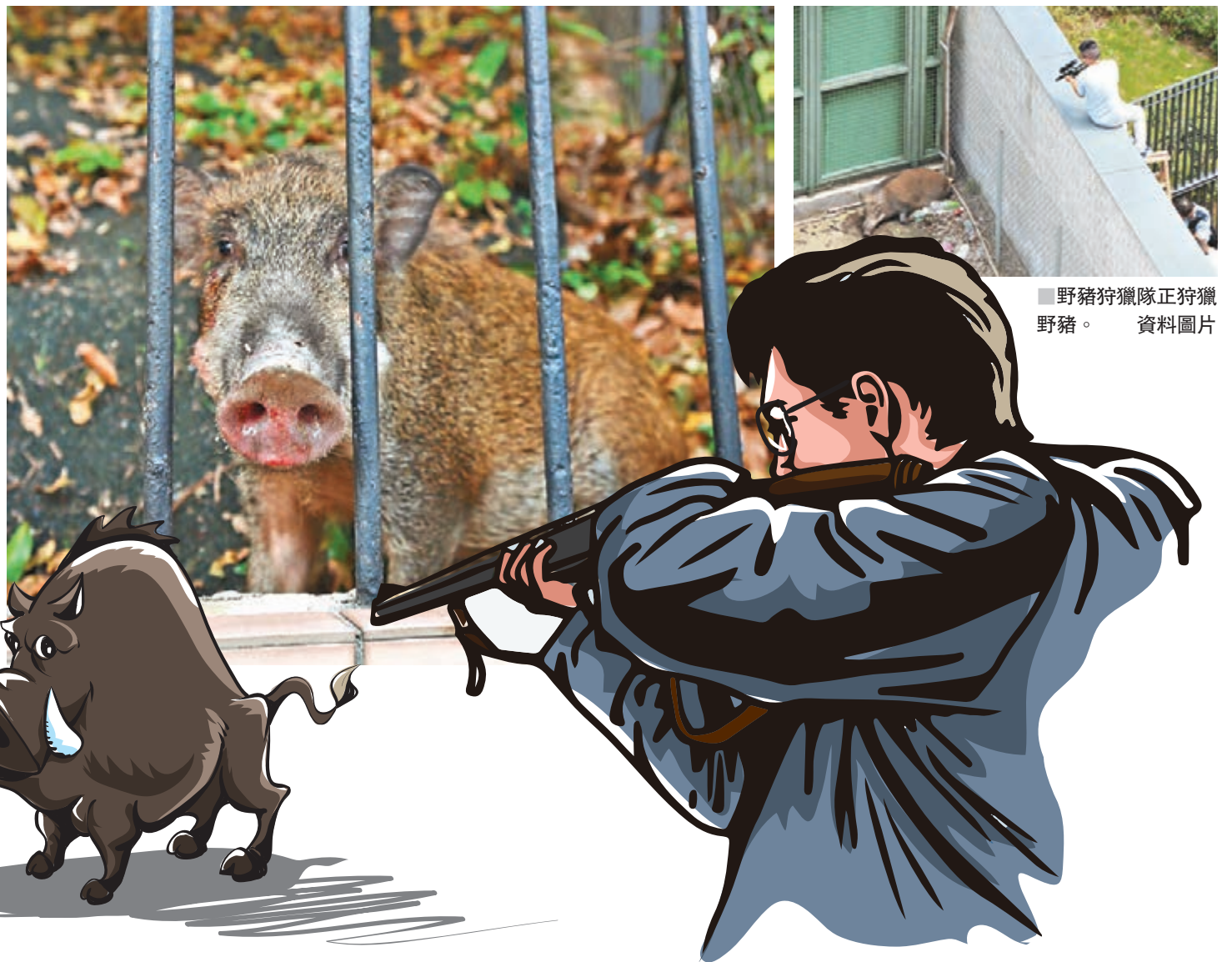
野豬狩獵隊正狩獵野豬。資料圖片