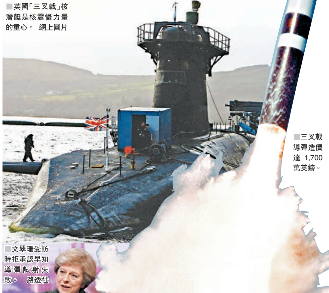
三叉戟導彈造價達1,700萬英鎊。