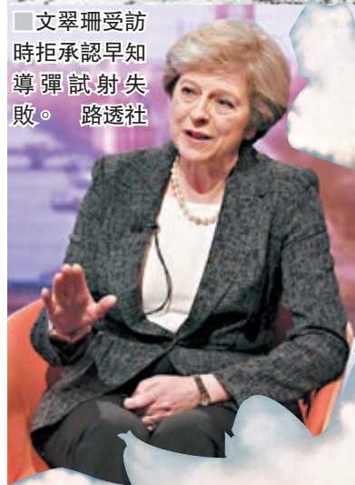
文翠珊受訪時拒承認早知導彈試射失敗。