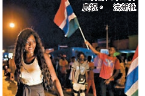
首都民眾上街慶祝。法新社

西非5國部隊的車隊昨日早上開入岡比亞，協助確保巴羅順利接掌權力，車隊過境時，曾遭親賈梅的勢力開火襲擊。賈梅下台消息傳出後，首都民眾紛紛上街歡呼慶祝，表示終獲自由。 ■法新社