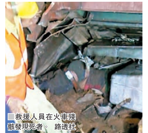
救援人員在火車殘骸發現死者。