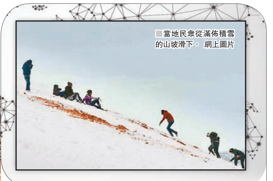
當地民眾從滿佈積雪的山坡滑下。網上圖片

澳洲在2015至2016年度共接待約4,000萬名經海、空路入境的遊客，預計計劃可大幅縮減旅客入境等候時間。據報當局有意今年7月於首都堪培拉機場試行計劃，至11月擴展至全國其他主要機場。《衛報》/《悉尼先驅晨報》