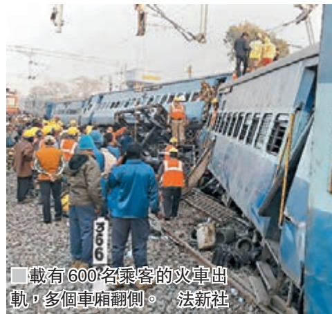
載有600名乘客的火車出軌，多個車廂翻側。