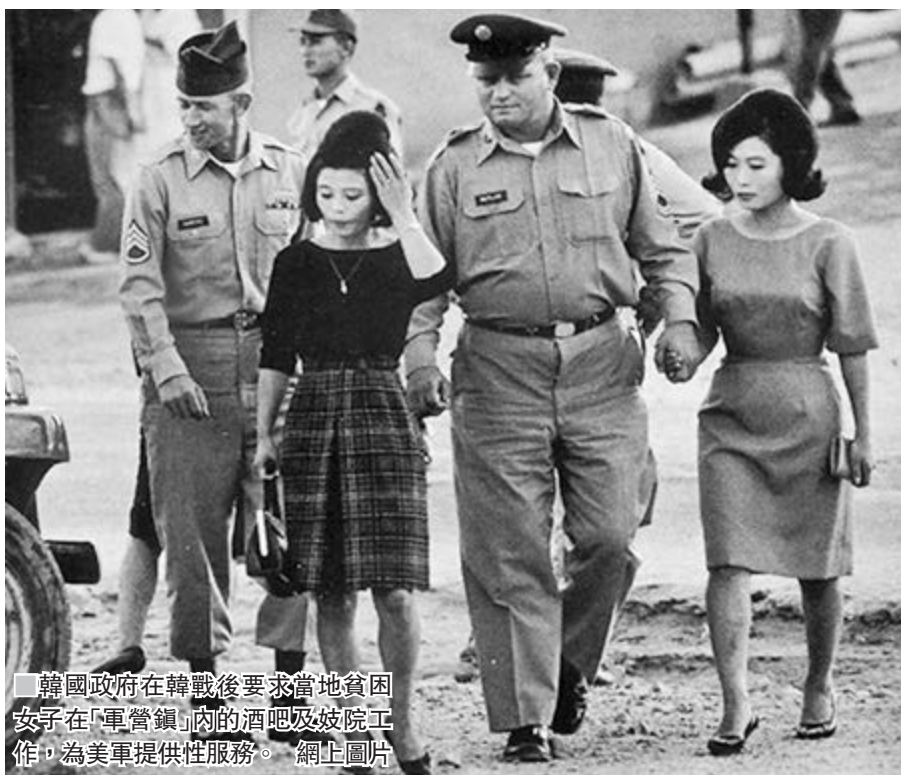
韓國政府在韓戰後要求當地貧困女子在「軍營鎮」內的酒吧及妓院工作，為美軍提供性服務。

當局一直拒絕承認參與「軍營鎮」運作，也拒絕就侵犯人權承擔責任。超過120名受害人2014年入稟法院，要求政府賠償，以及就當年囚禁及強迫她們接受性病治療