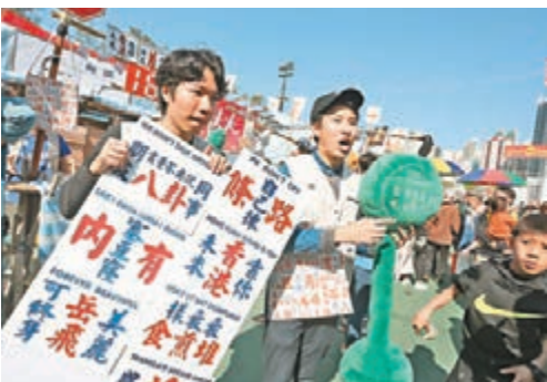
小巴站牌除了有站名外,還標有各種港式俚語,相當搶眼。

年宵除了全是雞外,也有不少本地意念的產品,如打工仔深夜放工必搭的紅色小巴將會於年宵「重現」,有年輕人將小巴站牌製成燈箱、帽子及袋子,期