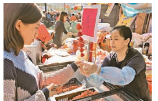
李小姐的糖葫蘆熱賣。