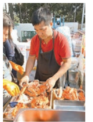
「阿拉斯加皇帝蟹」反應不俗。

主打北京糖葫蘆的甜品攤檔李小姐表示,十幾年來一直在元宵市場擺檔,往年第一日不會有太多客,但今年首日開鑼剛好是周日,人流超多,銷情亦好過以往,希望為新一年打響頭炮。