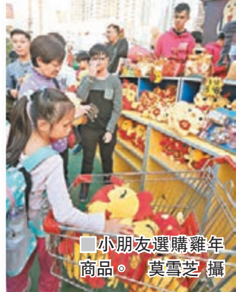
小朋友選購雞年商品。

另外,海關人員早上亦到維園巡查,暫時未發現有檔位銷售懷疑侵權物品。海關向檔主派發傳單,呼籲查證來貨的真偽,切勿售賣侵權物品。