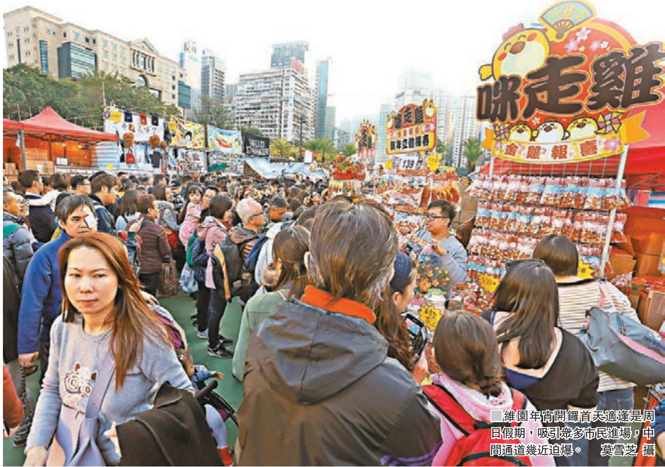
維園年宵開鑼首日適逢是周日假期,吸引眾多市民進場,中間通道幾近迫爆。

香港文匯報訊(記者 楊佩韻、陳文華) 送猴迎雞過肥年!一連七日的2017年維園年宵市場昨日開鑼,今年最大特色就是以雞年貨品為主題,尤其是乾貨攤位大部分都出售與「雞」相關產品,如雞尾包攬枕、「做到隻雞咁嘅樣」的長頸雞枕及雞公仔風車等,難怪有市民經過攤位都不禁說出網絡潮語:「雞,全部都係雞」。年宵首日適逢是周日假期,下午時分吸引眾多市民進場,中間通道幾近迫爆。亦有市民入園「刺探」年花銷情,打算最後數日才出手,但有花農料今年水仙及桃花會很快售罄。