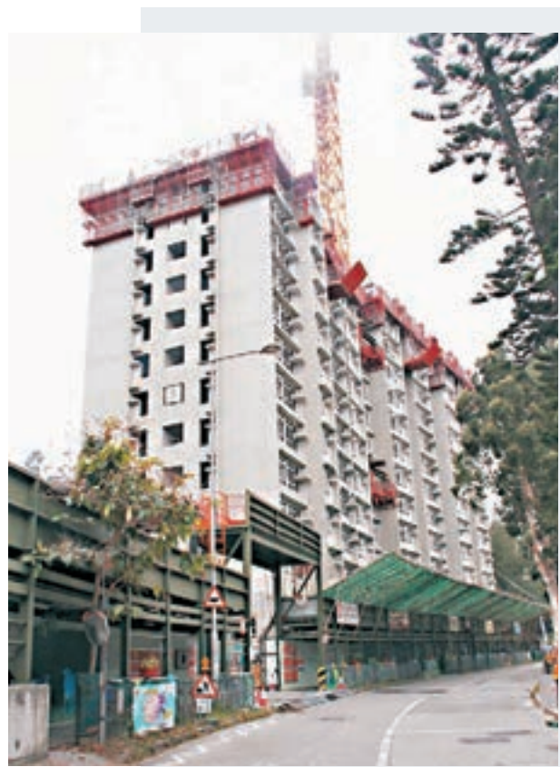
銀礦灣路東居屋項目毗鄰銀灣邨。