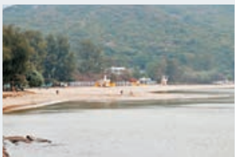
梅窩銀礦灣沙灘，兩新居屋部分高層單位可望到海景。

至於中學方面，在人口變化和殺校政策下，梅窩的中學早年因中一收生不夠三班，未達教育局之要求，已經停辦。全離島區的中學生，只能往東涌、大澳或長洲上學。離島區有11所中學，其中1所是官立中學、1所私校、6所是資助中學，還有3所是直資中學。