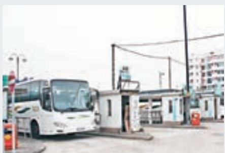
梅窩碼頭旁邊的巴士總站，有前往東涌、機場、大澳及天壇大佛等路線。