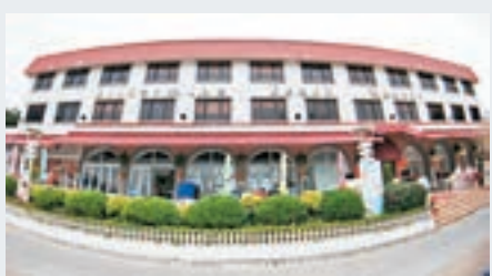
梅窩銀礦灣沙灘前的度假屋，內有餐廳。