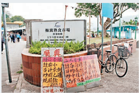
梅窩熟食市場，內有茶餐廳、小食店及海鮮店。