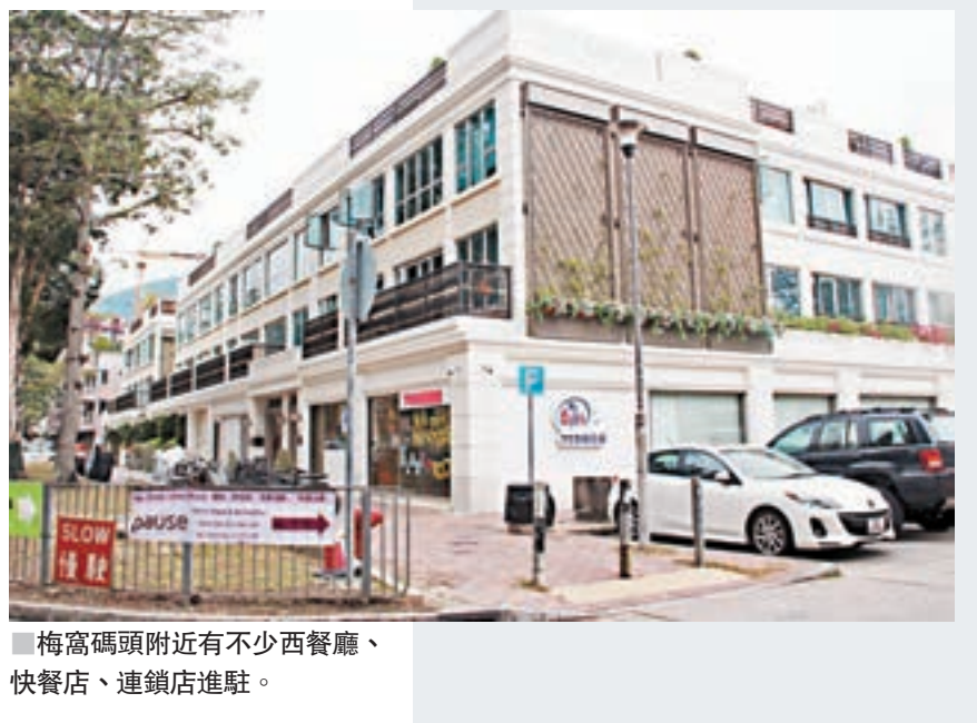
梅窩碼頭附近有不少西餐廳、快餐店、連鎖店進駐。

據政府現時公佈的資料，銀礦灣路項目主要分成東面及西面兩個居屋項目，其中西面項目的發展規模較大，用地毗鄰梅窩消防局，提供約500伙單位。至於銀礦灣路東居屋項目毗鄰銀灣邨，料提供200伙。兩居屋項目合共可供超過2,200人居住。