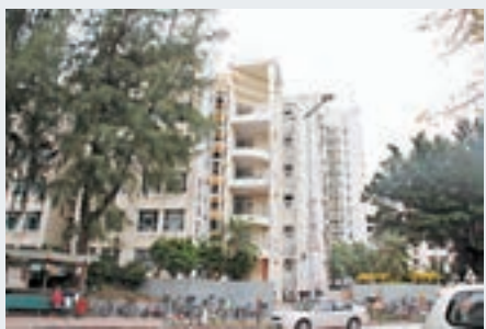
銀礦灣路東居屋旁的銀灣邨。

事實上，政府亦知道在該區建居屋的受歡迎程度較低。房委會資助房屋小組委員會主席黃遠輝早前表示，為達到長遠房屋供應目標，無可避免需要離島區的居屋供應，除規劃中的梅窩用地外，其他可能地點尚有南丫島索罟灣前南丫石礦場；較長遠而言，大嶼山填海計劃當中也可能納入居屋元素。魚與熊掌不可兼得下，或許離島居屋其實亦可以是一個選擇。