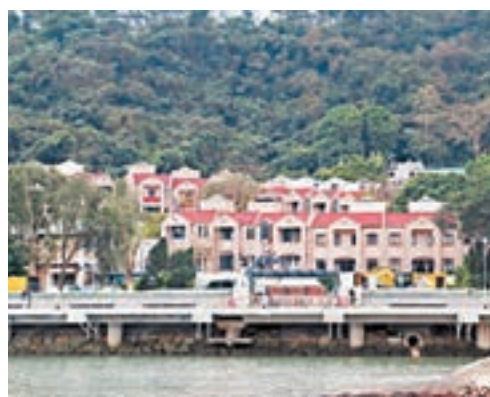
居屋附近的低密度住宅屋苑富瑤小築。