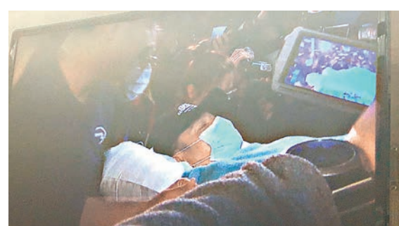
劉德華昨日凌晨坐專機回港就醫。

香港文匯報訊(記者 吳文釗) 寰宇集團昨晚於尖沙咀洲際酒店舉行30周年晚宴，多位圈中人幕前幕後均有到賀，提早到來的黃秋生笑言要向兩位大老闆楊受成和林小明找工作，三人不時密密傾偈似有大計籌備中。老闆林小明透露今年公司大計會開拍《逃出生天2》及《掃毒2》，而劉德華演出的《拆彈專家》將於4月底上映。提到華仔受傷回港就醫一事，林小明不擔心時新片上映會影響宣傳，希望華仔早日康復。至於與江若琳的官司，林小明表示應該今年內能解決，坦承現在與對方已達沒說話可談的地步，現在首要解決合約上問題，因雙方合約原本是到2019年，原則上對方要賠錢給他，但一切要由法官宣判。秋生表示有傳短訊問候華仔，他說：「目測來說他應該不太嚴重，華仔是不死身希望他沒事，騎馬好得人驚的，癲起來很可怕。」