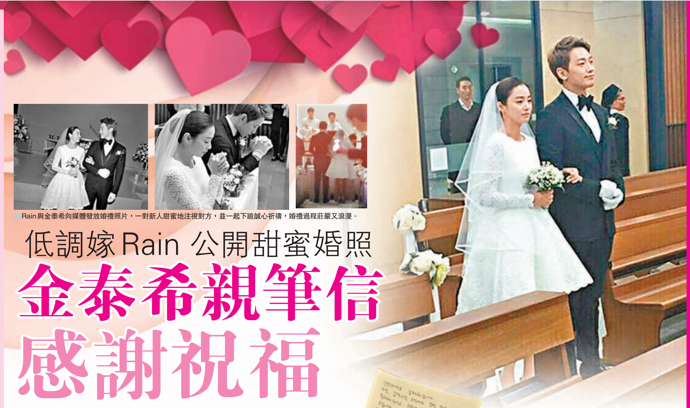
Rain與金泰希向媒體發放婚禮照片，一對新人甜蜜地注視對方，並一起下跪誠心祈禱，婚禮過程莊嚴又浪漫。