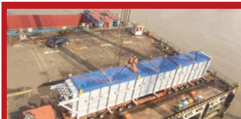
■ 211T 駁船吊裝

中巴煉油項目是「中巴經濟走廊」重點項目之一。據悉,2013年上半年,中國、巴基斯坦兩國高層互訪後,雙方啟動「中巴經濟走廊」規劃建設事宜,中巴之間的基礎設施建設、投資、能源等領域,成為此次交流的重要合作目標。在此前提下,2015年起中石化參與巴基斯坦國家煉油公司煉油改擴建項目(二期)工程,並於去年進行項目的實際運作。該項目大部分材料均由中國出口,並由貴州盤江物流公司旗下中亞寶豐上海分公司成功中標特貨運輸業務,不經意間成為「中巴經濟走廊」的先行者。