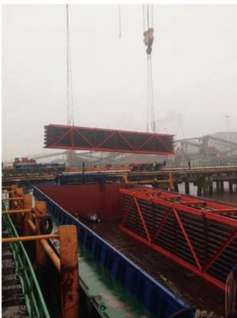
■ 62T 駁船吊裝